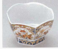
08414-554 金彩錦草花六角小鉢 900円 80入 (11×7cm)