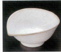
08416-454 鐘ボカシ変型鉢 880円 60入 (16×15.5×6.2cm)