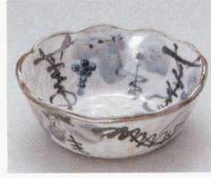
08409-314 粉引ぶどう小鉢 900円 80入 (13×4.5cm)