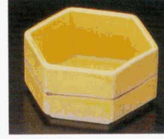
08420-574 黄釉錆筋六角小鉢 880円 (9×7.8×4.4cm)