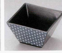
08430-114 黒麻格子四角鉢 800円 (11×6.5cm)