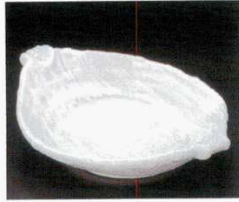
08407-234 堀川 瀧 (小) 手付鉢 900円 (17.5×13.5×4.3cm)