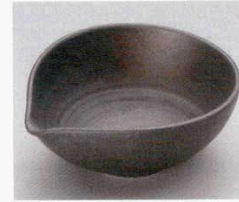
08426-294 黒片口ボール (小) 830円 60入 (13×11×5.2cm)