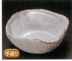
08404-574 粉引刷毛角小鉢 900円 (10.5×4cm)