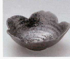
08410-454 黒吹桜型鉢 900円 60入 (14×5.5cm)