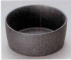
08402-304 鉄ペーパー切立 小鉢 930円 80入 (11.2×11.2×5cm)