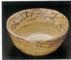
08406-474 あさぎ多用鉢 900円 80入 (12.5×4cm)