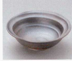
08418-554 焼炎小鉢 880円 80入 (12.3×4.5cm)