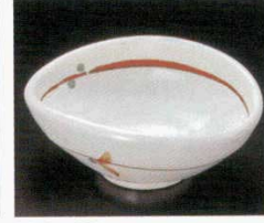
08424-254 粉引タマゴ4.0小鉢 850円 60入 (14×12.8×5.5cm)