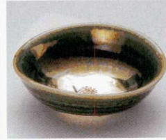
08417-564 織部椿ダ円小鉢 880円 80入 (13.4×12.3×4.5cm)