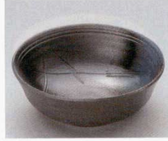
08413-314 雲海声反小鉢 900円 100入 (12.5×4.5cm)