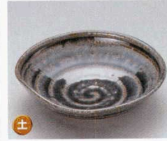
08422-174 紺ビードロ5.0平鉢 860円 40入 (15.2×15×4cm)