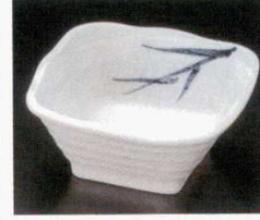
08428-034 石焼木目角4.5小鉢 800円 (13.6×13.6×5.7cm)