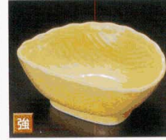
08427-554 黄楕円小鉢 820円 80入 (11.6×10.3×5.8cm)