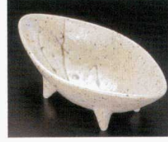
08415-234 オアシス四つ足小鉢 900円 60入 (16.3×8.5×5cm)