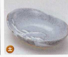
08425-454 青志野小判鉢 840円 60入 (16×11.5×3.5cm)