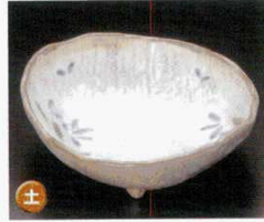
08412-514 花小道三つ足中鉢 900円 60入 (15.2×14×4.5cm)