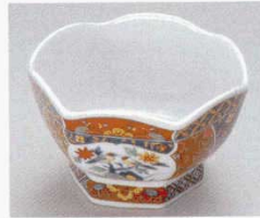
08411-554 錦花鳥六角小鉢 900円 80入 (11×7cm)