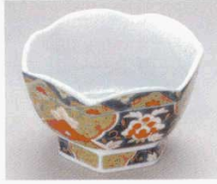
08408-554 緑彩六角小鉢 900円 80入 (11×7cm)