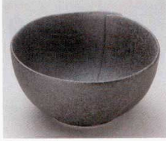
08403-304 鉄ペーパーハス ポウル 930円 100入 (11.6×11.6×6cm)