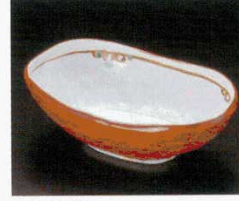
08419-134 朱巻楕円小鉢 880円 80入 (13.6×8.4×4.6cm)