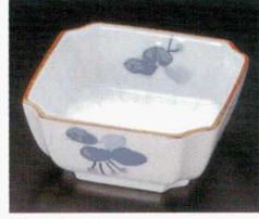
08405-734 まんりょう 角小鉢 (有田焼) 950円 10×8入 (10.5×10.5×4.5cm)