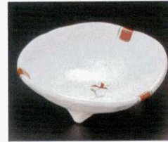
08421-124 帯小花三ツ足小鉢 870円 80入 (14.5×14×4.5cm)