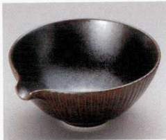
08401-474 火色流し縞目片口鉢 930円 30入 (15.3×14×6.7cm)