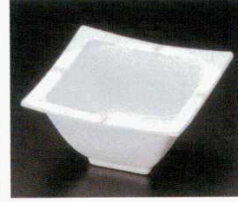
08423-234 千段 (茶) 角小鉢 800円 (11.3×6.3cm)