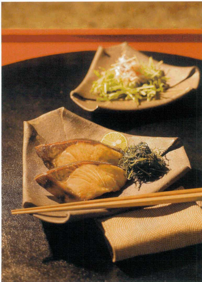
ぶりの塩照り焼き 脂のった旬のぶりならではの、シンプルな料理。 個性的な器に盛って、違いの良さを引き出します。

木々の変化に冬の訪れを感じる時、温かい家の中で にぎやかに鍋をする回数も自然と増えます。 現代的にアレンジされたモダンな「和」をプラスすると、 よりいっそうハイセンスな食卓に。