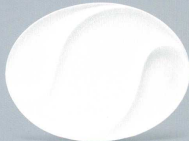
50481-3510 30cmピュッアトレイ 5,250円 (本体5,000円)CT/6(1×6)<145×230×55>