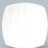
50786-5354 17cmスクエアレリーフプレート 1,050円(本体1,000円) (対角17cm・14.7cm角)CT/20(5×4) <175×175×80>