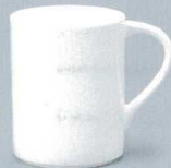
50481-2633 マグ 1,365円 (本体1,300円) (260cc) CT/24(1×24) <110×105×115>