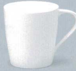
50481-2697 マグ(B) 1,365円 (本体1,300円) (200cc) CT/24(1×24) <110×105×115>