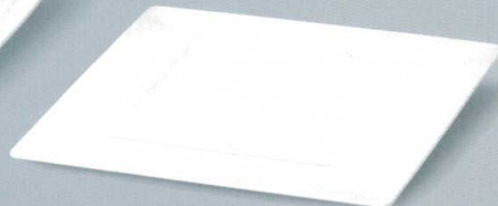
50131-5353 27cmスクエアリムプレート 5,775円 (本体5,500円)(対角38cm・27.4cm角) CT/20(5×4)<305×295×105>