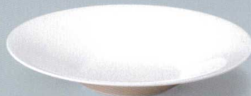
New 50481-5352 27cmディープディッシュ 3,675円(本体3,500円) (径27.7cm) CT/18<300×300×55>