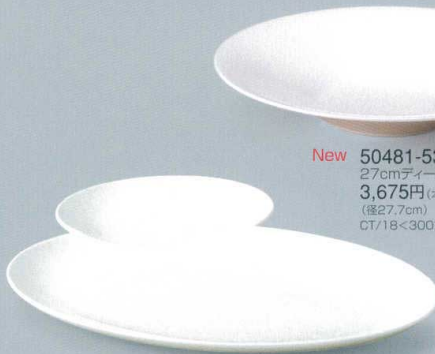
50481-3525 ダブルプレート 4,200円(本体4,000円) (長径30.5cm)CT/6 <315×310×40>