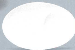
50481-3503 ディット・ピット・トレイ 2,100円 (本体2,000円)(長径20.5cm) CT/30(5×6)<145×235×30>