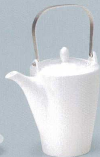
50481-4560 ポット 8,400円 (本体8,000円) (高さ13.5cm・300cc) CT/24(1×24)<100×125×130> ステンレス製ハンドル・蒸こし付