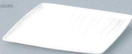
50786-3526 26cmスクエアレリーフプレート 4,200円 (本体4,000円)(対角35cm・26.5cm角) CT/20(5×4)<305×295×105>