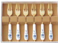
ケーキフォーク(ゴールド) 9682-623(6本) 12,600円 (本体 12,000円)CT/28 <155×200×25> 9682-9384F(1本) 2,100円 (本体 2,000円)CT/90

上品でシンプルな柄は、どんなデザインの食器にも良く合います。使う機会も多く便利な小物です。