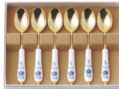
ティースプーン(ゴールド) 9682-622(6本) 12,600円 (本体 12,000円)CT/28 <155×200×25> 9682-9384S(1本) 2,100円 (本体 2,000円)CT/48