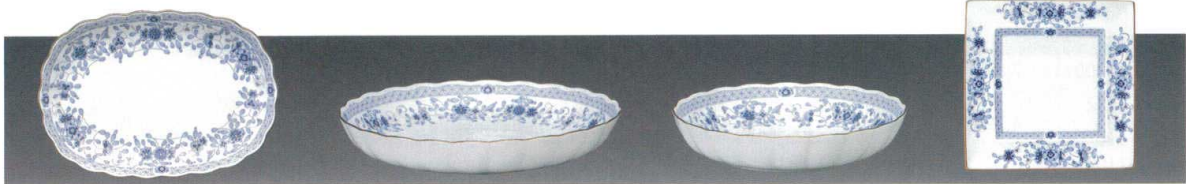
9682-1459 25cmサントイッチトレイ 5,775円 (本体 5,500円)CT/28(1×28)