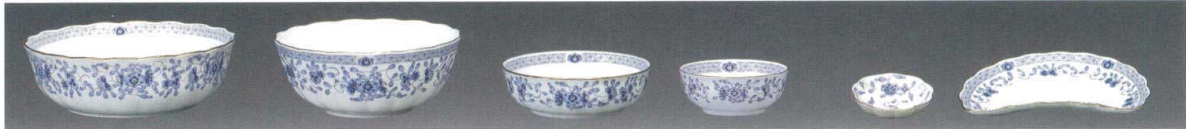
9682-3177 23cmサラダボール 7,350円 (本体 7,000円)CT/16(1×16)