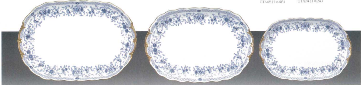
9682-1991 42cmプラター 26,250円 (本体 25,000円)CT/8(1×8)