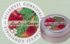
KC440-5 フレーバーティー 683円(本体 650円) 「アップル&マンゴー」(30g)オリジナル缶入り(7.5cm) 香り高く甘酸っぱいリンゴにとろける ような甘いマンゴーの香りをミックス シナモンを添えると、スパイシーなフルーツティーに。 ミルクを添えると、ミルクティーになります。