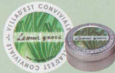
KC440-8 フレーバーティー 683円(本体 650円) 「レモングラス」(30g)オリジナル缶入り(7.5cm) レモンに似たフレッシュな香りの レモングラスフレーバー。 ストレートのままアイスティーにしても美味しい。