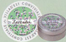
KC440-7 フレーバーティー 683円(本体 650円) 「ラベンダー」(30g)オリジナル缶入り(7.5cm) ラベンダーの優しい香りの紅茶。 ミルクティーにして、砕いたナッツを浮かべたり、 洋酒を使った焼き菓子にもピッタリ。