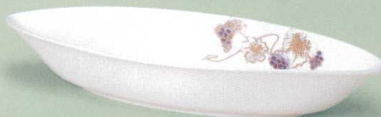
50709-3482 33cmオプロングボール 4,200円 (本体 4,000円)「ぶどう」CT/12 <140×335×60>