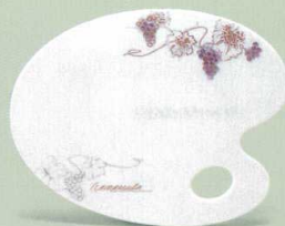
50709-9730 23cmバレットプレート 3,675円 (本体 3,500円)「ぶどう」CT/18 <190×230×20>

ヴィラデストの代表的収穫物の「ぶどう」。 10月に収穫される黒ぶどう「メルロー」をデザインしています。 メルローは赤ワインの原料として使われます。 ぶどうの実を漬したものと皮を一緒に醗酵させることにより 赤ワイン独特の色としぶ味が得られます。