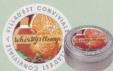
KC440-1 フレーバーティー 683円(本体 650円) 「ウイスキー&オレンジ」(30g)オリジナル缶入り(7.5cm) スモーキーで深みのあるウイスキーに柑橘系 フルーツを添えて、さっぱりと仕上げました。 フルーツを使ったアレンジティーに良く合います。 オレンジやストロベリーやリンゴのスライスを浮かべると。