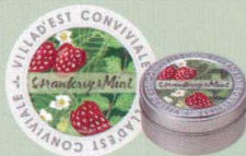
KC440-4 フレーバーティー 683円(本体 650円) 「ストロベリー&ミント」(30g)オリジナル缶入り(7.5cm) 探れたてのみずみずしい苺に、 爽やかなミントのフレーバーを添えました。 砂糖を加えて甘味を足すと、ストロベリーの甘酸っぱさが 引き立ちます。ミルクを加えると、ミルクティーの紅茶に、 ミントの爽やかな風味が楽しめます。