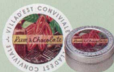
KC440-2 フレーバーティー 683円(本体 650円) 「ラム&チョコレート」(30g)オリジナル缶入り(7.5cm) リッチでこくのあるチョコレートに 上質のラム酒を添えたフレーバーです。 ミルクティーにして、砕いたナッツを浮かべたり、 洋酒を使った焼き菓子にもピッタリ。