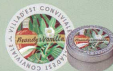
KC440-3 フレーバーティー 683円(本体 650円) 「ブランデー&バニラ」(30g)オリジナル缶入り(7.5cm) 蒸餾で大人の香りのブランデーに天然 バニラの甘く柔らかな香りも添えました。 洋酒を使った焼き菓子にもピッタリ。