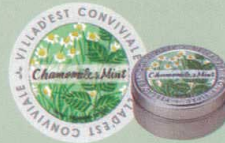
KC440-9 フレーバーティー 683円(本体 650円) 「カモミール&ミント」(30g)オリジナル缶入り(7.5cm) 甘いリンゴのような優しい香りのカモ ミールにミントを添えて、清涼感を。 アイスティーにしても美味しい。 バニラアイスクリームを浮かべて。