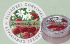
KC440-6 フレーバーティー 683円(本体 650円) 「ジャスミン&ライチ」(30g)オリジナル缶入り(7.5cm) エキゾチックなジャスミンの香りに、 繊細なライチの香りを添えて。 砂糖を加えて甘味を足すと、ライチの香りが引き立ちます。 アイスにしても美味しい。