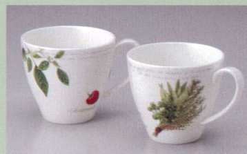
95602-21675 ペアマグ 5,250円(本体 5,000円) マグ(215cc)「アソート」2 「パ(ネロ・スカポロフェア)」CT/12 <125×205×90>