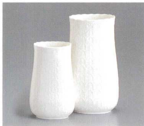
9968-150 15cm花瓶 3,150円 (本体 3,000円) CT/20<125×215×90>