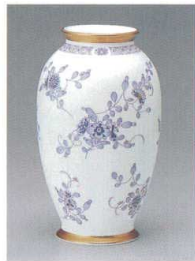
9682-169 23cm花瓶 10,500円 (本体 10,000円) (高さ23cm)CT/8 <280×185×160>