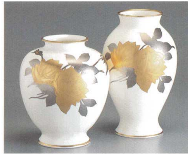
408-230 24cm花瓶 36,750円 (本体 35,000円)「本ケース」 CT/2<335×255×235>