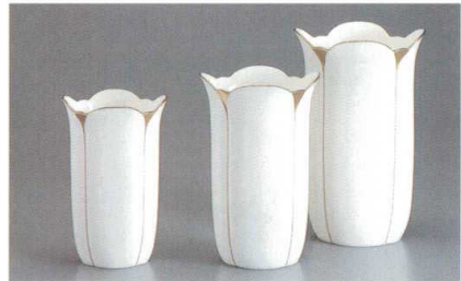
390-418 19cmフラワーベース 5,250円 (本体 5,000円) CT/20 <245×145×110>