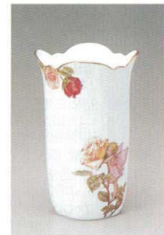
50222-418 19cmフラワーベース 5,250円 (本体 5,000円) CT/12<245×145×110>