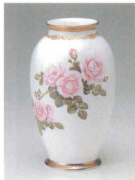
50422-169 23cm花瓶 10,500円 (本体 10,000円) (高さ23cm)「ニュードーン」 CT/8 <280×180×155>