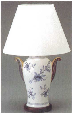
9682-L037 スタンド<ミラノ> 42,000円 (本体 40,000円) (高さ52cm)一般電球 (E26-40W) <395×560×410>CT/1