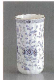
9682-550 18cmフラワーベース 5,250円 (本体 5,000円) CT/16<125×215×90>