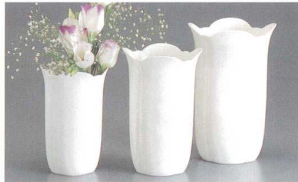
388-418 19cmフラワーベース 3,675円 (本体 3,500円) CT/20 <245×145×110>