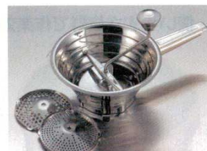
③ うらごし器 ART.451 18-10 外寸：φ200×H150 2902500 ※2.0・2.5・5.0mmの替刃3枚付 フランス