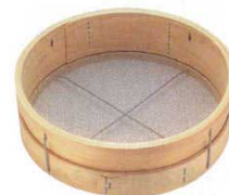
⑭ 砂糖フルイ(木枠) (10メッシュ) 商品コード 7寸(21cm) φ210×H90 8705400 8寸(24cm) φ240×H90 8705500 9寸(27cm) φ270×H90 8705600 R (30cm) φ300×H90 8705700 R1(33cm) φ330×H90 8705800 R2(36cm) φ360×H90 8705900