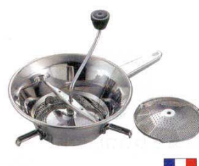
⑩ ムーラン 18-10 LT 商品コード N3002 20cm 205 104 83 3941900 N3004 24cm 240 127 100 3942000 ※1.5mm、2.5mmの替刃2枚付 ※丈夫なステンレスタイプ