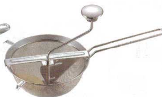
② ストレーナープレス 24500 ボール型 INOX Gefu 7271900 ボール：内径 190×H90 全長 375 全高 200 メッシュボールタイプなので、きめ細かな裏漉しに最適。(17メッシュ太網)