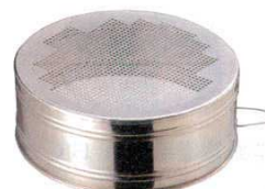
⑪ そぼろフルイ パンチング 18-8 商品コード 細目 約2.4mm目 8333000 荒目 約3.5mm目 8333100 φ245×H90