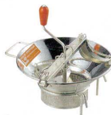
⑥ ムーラン M5 スズメッキ LT 37cm A360 B176 C170 0458400 ※1.5mmの替刃付 ※材質：鉄スズメッキ 野菜・果物等の裏漉しに使用します。