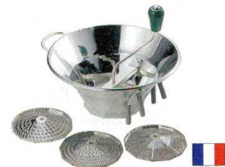
⑨ ムーラン S3 スズメッキ LT 31cm A310 B140 C130 0458500 ※1.5mm、2.5mm、4mmの替刃3枚付 ※材質：鉄スズメッキ