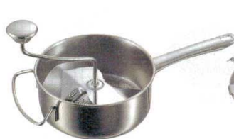
① ストレーナープレス 24100 鍋タイプ INOX Gefu 7271800 ボール：内径 190×H80 全長 390 全高 190

しっかりしたINOX製であらゆる裏漉しに最適。底に付いているワイヤーが裏漉しされた食品を削ぎ落としますので、スパチュラは不要。