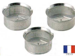
⑦ ムーラン 37cm用替網 スズメッキ LT 商品コード M5010 1mm目 0458800 M5015 1.5mm目 0458900 M5020 2mm目 0459000 M5030 3mm目 0459100 M5040 4mm目 0459200