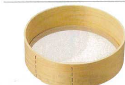
⑫ 粉フルイ(木枠) ステン張 (24メッシュ) 外寸 商品コード 7寸(21cm) φ205×H75 0455500 8寸(24cm) φ240×H90 0455600 9寸(27cm) φ270×H90 0455700 R (30cm) φ300×H90 0455800 R1(33cm) φ330×H90 0455900 R2(36cm) φ355×H95 0456000