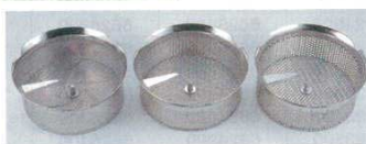
⑤ ムーラン 37cm用替網 18-10 LT 商品コード X5010 1mm目 8400400 X5015 1.5mm目 8400500 X5020 2mm目 8400600 X5030 3mm目 8400700 X5040 4mm目 8400800