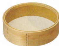
⑬ 粉フルイ(木枠) 真鍮張 (24メッシュ) 外寸 商品コード 8寸(24cm) φ240×H75 3075600 9寸(27cm) φ270×H90 3075700 R (30cm) φ300×H90 3075800 R1(33cm) φ330×H90 3075900 R2(36cm) φ355×H95 3076000