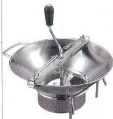
④ ムーラン X5 18-10 LT 37cm A360 B176 C170 8400300 ※1.5mmの替刃付 ※丈夫なステンレスタイプ