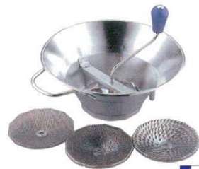
⑧ ムーラン 18-10 LT 31cm A310 B140 C130 8400200 ※1.5mm、2.5mm、4mmの替刃3枚付 ※丈夫なステンレスタイプ