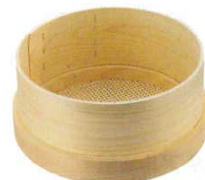
⑮ そぼろふるい(木枠) 籐製 細目 約2.0mm目 6849700 8寸 φ253×H110