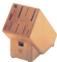
⑥ ナイフブロック 35006 木製 ツヴィリング

130×270×H230 3509800 収納数: 幅広牛刀26cm-2丁 細身牛刀23cm-3丁 細身牛刀16cm-2丁 ペティナイフ14cm-1丁 スチール棒1本 皮ムキ1本