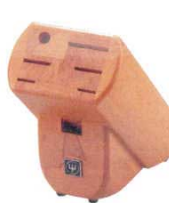
⑧ ナイフブロック No.7233 木製 ドライザック

115×280×H230 5837300 収納数: 牛刀23cm-1丁 カービングナイフ20cm-1丁 細身スライサー 20cm-1丁 ペティナイフ14cm-1丁 スチール棒23cm-1本 ペティナイフ12cm-2丁 小物庖丁12cm-6丁 サンドイッチナイフ16cm-1丁 トマト・ソーセージナイフ16cm-2丁