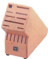
⑦ ナイフブロック No.7240 木製 ドライザック

130×270×H230 3509800 収納数: 幅広牛刀26cm-2丁 細身牛刀23cm-3丁 細身牛刀16cm-2丁 ペティナイフ14cm-1丁 スチール棒1本 皮ムキ1本