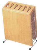
⑮ 木製庖丁ハサミスタンド 6丁用 AP0524 3527500

●優れた品質を誇る特殊鋼を使用し、プロも認める伝統のドイツ刃物の特長と形状を取り入れ、鋭い切れ味はもとより、刃と柄の一体構造により、より安全かつ衛生的で重さとのバランスに優れています。 ●これだけ揃えばお料理は万全 セット内容: 牛刀 刃渡り: 205-1本 三徳菜切 刃渡り: 180-1本 ペティナイフ 刃渡り: 115-1本 ウェーブナイフ 刃渡り: 224-1本 中華型庖丁 刃渡り: 172-1本 スチール棒 200-1本 万能キッチンバサミ1本 木製ナイフブロック1個