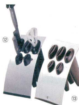
ナイフブロック シンプルタイプ 18-0

238×188×H138 重量: 798g 材質: 本体/天然木 ワイヤー/18-8ステンレス ●コンパクトな庖丁ハサミスタンド。包丁5本、キッチン鉋1丁が収納できます。