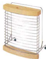
⑯ 木製庖丁まいたスタンド AP0522 3527400

材質・本体: 18-0ステンレススチール 刀座: ABS樹脂 (抗菌材入り) 差込み穴は大3小2 キッチンバサミも収納出来ます。 3種類のスロットに、ほとんどの庖丁が収納できます。 ※スロット 大 牛刀・万能庖丁 24cm 菜切 18cm 出刃庖丁 17cm 小 ペティナイフ 16cm 特大 キッチンバサミ 厚み15mmまで