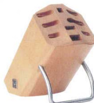
⑪ ナイフブロック クリナー DZ 7256 ナチュラル 4127800

90×280×H195 収納数: 牛刀20cm-1丁 細身スライサー 20cm-1丁 トマトナイフ14cm-1丁 パーリングナイフ8cm-1丁 キッチンフォーク16cm-1本 スチール棒23cm-1本 パン切りナイフ20cm-1丁 パーリングナイフ10cm-1丁