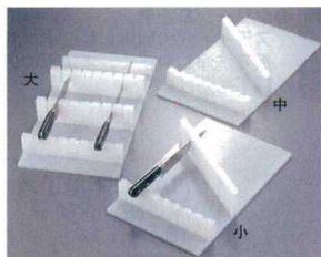
① 庖丁置台 PC製 EBM