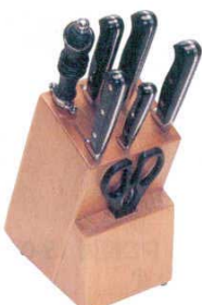
⑭ キングダム Cuttingマスター 8点セット 3085500

140×240×H215 収納数: 牛刀20cm-1丁 細身スライサー 20cm-1丁 パン切りナイフ20cm-1丁 トマトナイフ14cm-1丁 パーリングナイフ8cm-1丁 ユーティリティナイフ10cm-1丁 スチール棒23cm-1本 キッチンフォーク16cm-1本 キッチンバサミ1本