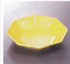
テ-11313 612206 860円 黄釉八角皿 120入 12×11.5×2.4cm