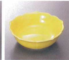
ウ-11305 612513 630円 黄桔梗平鉢 120入 10.7×3.6cm