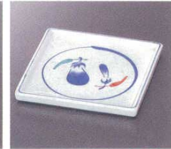
テ-11325 612335 880円 ナヌ四角皿 120入 11×11×1cm