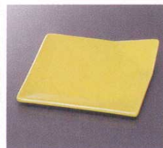
ウ-11328 612331 680円 黄角皿 150入 11.1×1.7cm