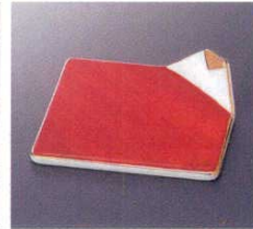
ホ-11323 611928 900円 朱刷毛測折皿 100入 11×11×2.5cm