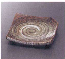
ス-11326 612333 690円 白刷毛4.0正角皿 120入 10.5×10.5×2.3cm