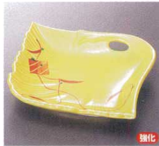
コ-11306 611909 1,100円 黄釉銀杏銘々皿 100入 11.5×11.5cm