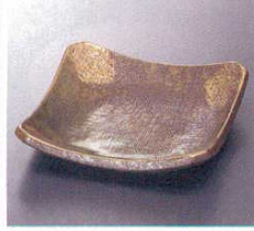
キ-11317 612229 1,100円 金彩吹織部正角皿 120入 11×11×2.3cm