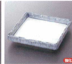
キ-11309 711309 980円 呉須測巻松花堂 100入 11.2×11.2×2.5cm