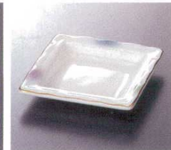
ヤ-11315 612332 800円 三色吹測金正角皿(大) 60入 10.8×2cm(中国製)