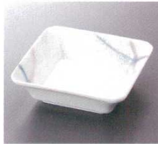
ツ-11301 711301 1,200円 二色ラスター角小鉢 80入 11×11×3.5cm