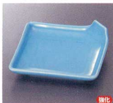
ウ-11327 612428 670円 トルコ角折皿 120入 10.8×3.5cm