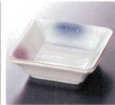
ヤ-11303 612325 780円 三色吹測金正角深皿(大) 80入 11.4×3.7cm(中国製)