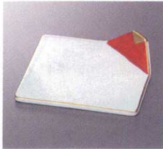
ホ-11321 612104 820円 朱金彩測折皿 100入 11×11×2.5cm