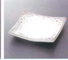
ヤ-11319 620819 900円 柴吹金箔正角四方皿(大) 60入 11.2×11.2×2cm(中国製)