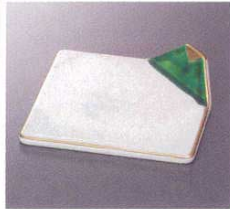
ホ-11322 612105 820円 緑交趾金彩測折皿 100入 11×11×2.5cm