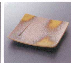
テ-11329 711329 650円 美膳角皿 80入 11.2×11.2×1.5cm