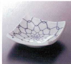
ヤ-11312 612222 850円 網目布正角厚測皿(大) 60入 10.5×10.5×3.5cm(中国製)