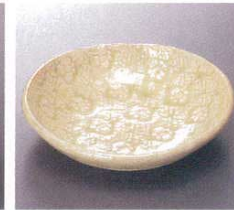
ホ-11304 611833 1,070円 灰釉印花皿 200入 12.3×2.7cm