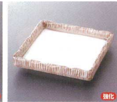
キ-11310 711310 980円 茶測巻松花堂 100入 11.2×11.2×2.5cm