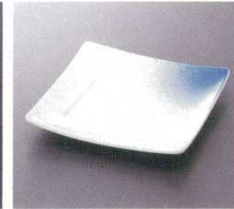
テ-11324 711324 650円 吹き墨角皿 80入 11.2×11.2×1.5cm