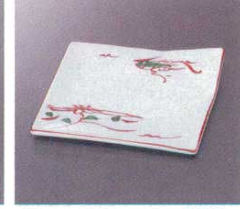
ウ-11320 612330 900円 花鳥角皿 150入 11.1×1.7cm