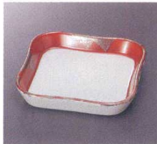
ホ-11311 612122 900円 朱巻銀彩三角紋ナテ角 100入 11.5×11.5×2.2cm