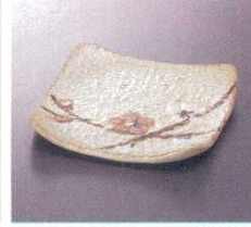
テ-11318 612334 860円 梅角皿 80入 10.8×10.8×1.6cm