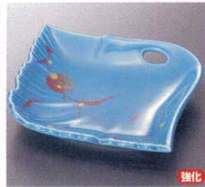
コ-11307 611910 1,100円 トルコ釉銀杏銘々皿 100入 11.5×11.5cm