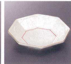
テ-11314 612207 990円 朱金線八角皿 120入 12×11.5×2.4cm