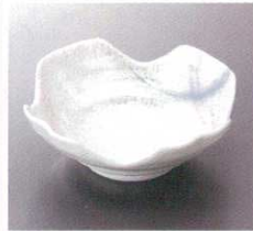
ツ-11302 711302 1,200円 ラスター二色吹四山小鉢 80入 11×4.5cm