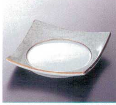
ハ-11316 612225 1,350円 測金グリーン吹き角皿 60入 11×11×2.3cm