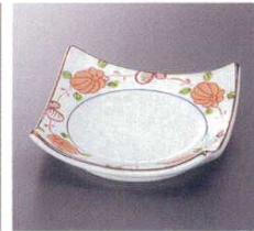
テ-11308 612121 1,030円 花唐草四方皿 80入 11.2×11.2×3cm