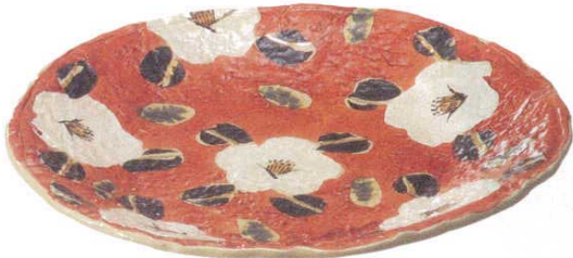
キ-13001 614005 7,300円 赤濃山茶花丸10.0大皿 10入 32.5×4.3cm