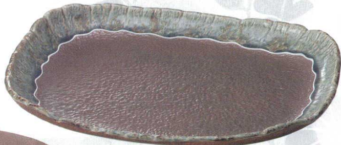
マ-13006 614006 6,720円 南蛮洩流し大皿 10入 39×30.5×4cm