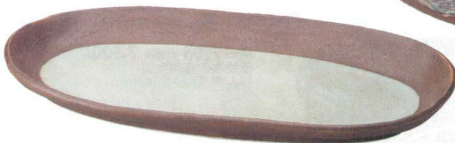
松葉志野 強化 ム-13007 614007 10,000円 楕円皿(大) 10入 39.5×19.7×4cm ム-13008 614008 5,000円 楕円皿(中) 15入 34.5×17×3.4cm