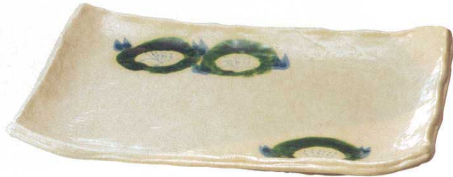
ホ-13002 613903 6,700円 椿の香角大皿 10入 37×26×4.5cm