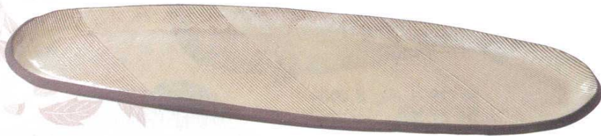
コ-13004 613901 6,500円 黒陶櫛目楕円大皿 1×10入 53×18.5×3cm