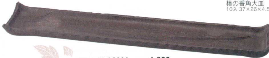
ツ-13003 614105 6,800円 炭化土18.0長皿 10入 53×10×3cm