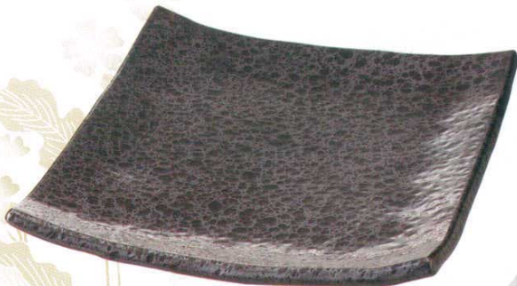
ヤ-13308 713308 11,000円 油滴天目足付盛皿(中) 16入 30×27×5cm