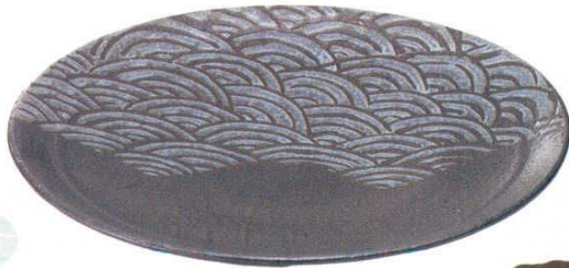
ヒ-13301 614306 8,000円 青海波10.0大皿 10入 32.2×4.5cm