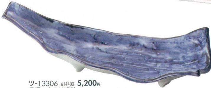
ツ-13306 614403 5,200円 呉須一方上り盛鉢 20入 43×15×10.5cm