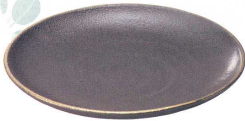
ハ-13302 614402 7,800円 いぶし金丸10.0皿 20入 30.5×4.3cm