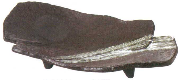
ヤ-13303 713303 5,500円 炭化白刷毛目盛鉢(大) 15入 38×22.5×7cm