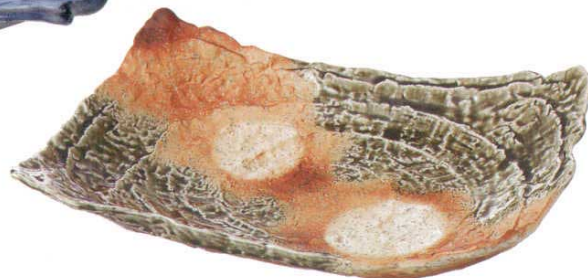
ヤ-13307 713307 5,000円 嵯峨野四方上がり盛鉢 20入 31×23×7cm