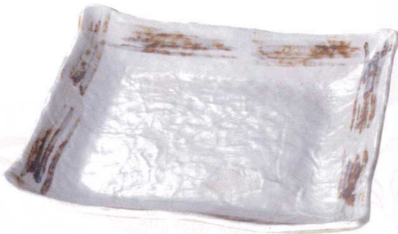
コ-13705 614701 4,800円 志野錆刷正角盛皿 20入 28.5×28.5×4cm