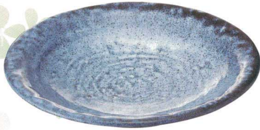
ス-13701 713701 4,400円 雪嶺石目10.0皿 20入 31.5×6cm