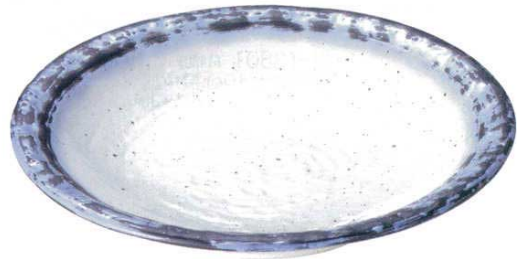
ス-13702 614706 4,100円 なごり雪石目10.0皿 20入 31.5×6cm