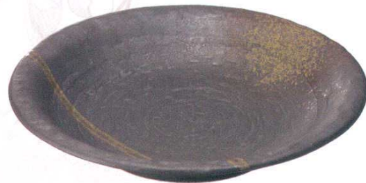
ニ-13706 614709 3,900円 南蛮吹流し石目10.0皿 10入 32.2×5.5cm