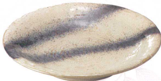
ス-13707 614804 3,700円 銀河石目10.0皿 15入 31.5×6cm