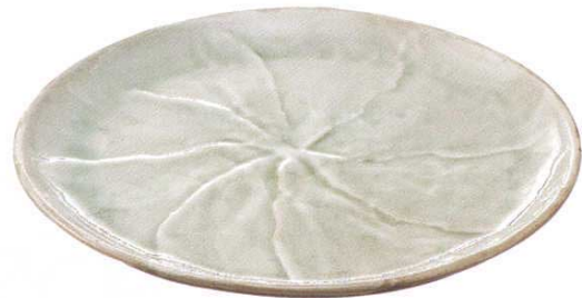
マ-13704 713704 4,240円 白雲丸大皿 20入 31×2.2cm