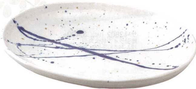
ヤ-13703 713703 4,600円 呉須吹楕円大皿 15入 37×29×4.7cm