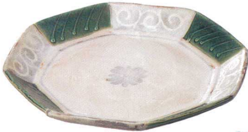
ワ-14001 615002 7,200円 志野織部大皿 1×10入 29.5×29.5×3cm