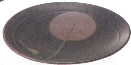
ヒ-14008 615007 5,500円 備前風草花紋9.0大皿 20入 28.5×4.5cm