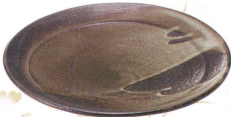
コ-14007 615006 5,500円 緑釉かいらぎ9.0丸皿 15入 28.5×4.5cm