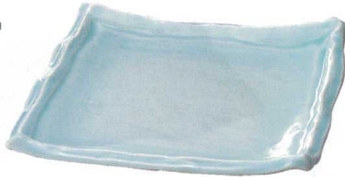
タ-14003 615003 7,000円 青白正角大皿 20入 26×26×4.3cm