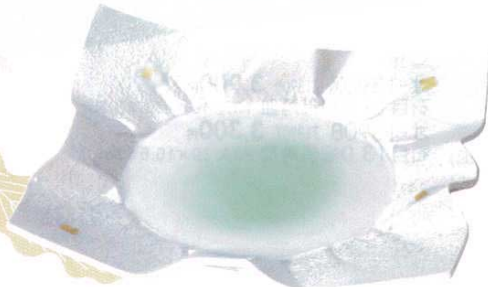
ラスター紙 ヤ-14010 615105 3,800円 鍋形26cm皿 15入 26.5×26.5×5.3cm ヤ-14011 615106 2,800円 鍋形21cm皿 24入 21×21×3.8cm