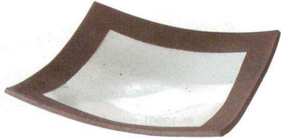
ユ-14002 714002 7,800円 白釉掛分け正角皿 10入 27.5×27.5×7cm