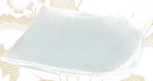
ヒ-14009 714009 4,500円 青白磁25.5cm正角皿 30入 25.5×25.5×2.5cm