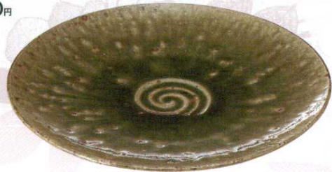
コ-14005 714005 7,200円 灰釉荒土9.0丸皿 10入 29×4.3cm