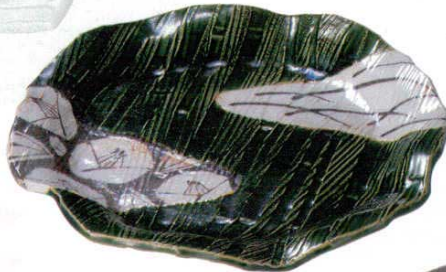
ワ-14006 615004 6,600円 織部好み大皿 1×16入 27×3cm