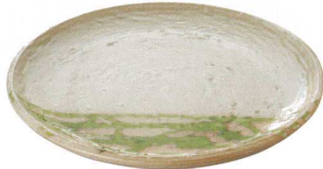
セ-14402 714402 2,500円 ビードロ丸9.0皿 20入 27.5×2.5cm