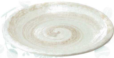
オ-14401 615401 2,550円 東風石目9.0皿 20入 27.8×3.6cm