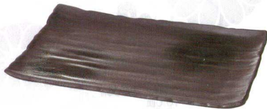
ツ-14408 714408 2,000円 炭化寿司皿 20入 31.8×21×2.3cm