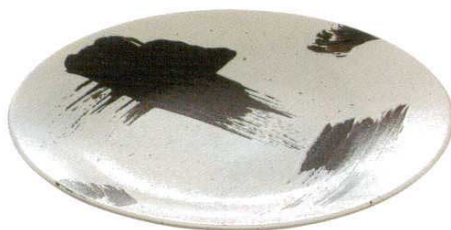
ヒ-14409 714409 1,680円 粉引黒刷毛目尺皿 30入 28.5×3.3cm