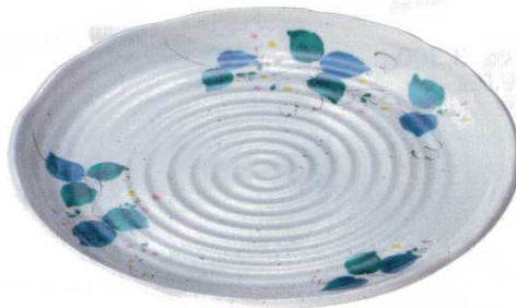
ナ-14406 615501 1,900円 粉引つゆ草10.0皿 15入 30×3.3cm