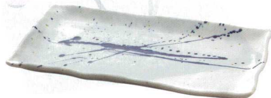
ヤ-14410 714410 1,600円 呉須吹柳目長角皿 20入 32×17×2.5cm