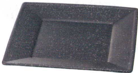
ヒ-14405 615407 2,400円 銀彩スクエア大皿 20入 26.5×26.5×2.8cm