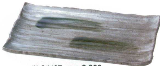
ツ-14407 614907 2,000円 青磁織部流寿司皿 20入 31.8×21×2.3cm