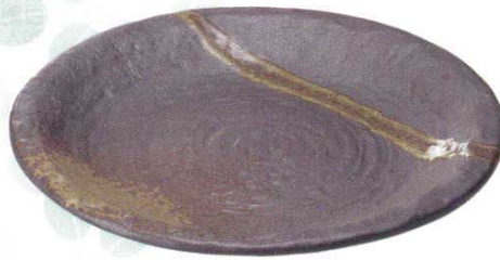
ニ-14403 615403 2,500円 南壺吹流し石目9.0皿 20入 27.3×3.6cm