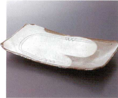
△-14601 714601 11,000円 灰釉粉引流し9.0長皿 10入 29.2×16×3.2cm