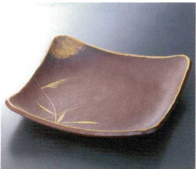
キ-14610 615605 5,300円 秋の詩10.0盛皿 20入 23.5×23.5×4.5cm