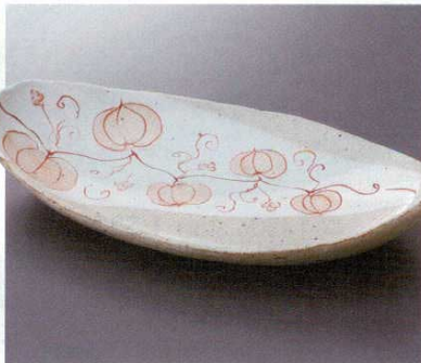
コ-14608 714608 6,000円 赤絵山帰来橢円盛皿(手造り) 1×12入 36.5×20×5cm