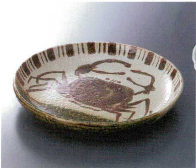
ヤ-14607 615603 6,000円 織部力二画8.0盛皿 20入 25.5×4cm