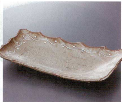
△-14603 714603 11,000円 灰釉線刻文10.0長皿 10入 31.5×16.5×4.2cm