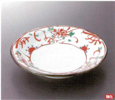
キ-14604 714604 6,400円 赤絵花8.0皿 20入 25×4.7cm