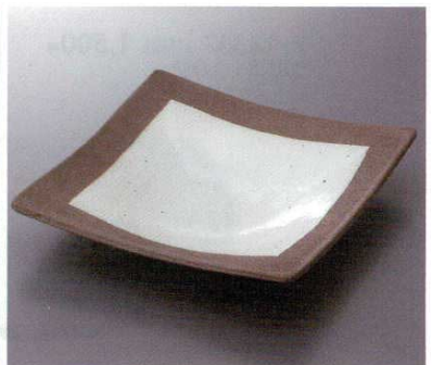
ユ-14612 714612 4,500円 白釉掛分け正角皿 10入 22×22×4cm