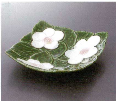
ワ-14611 714611 4,800円 織部桃つばき角盛皿 20入 22×22×6cm