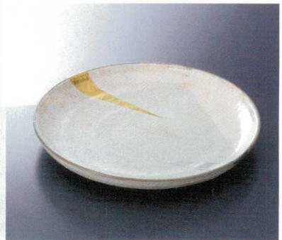
ホ-14606 615604 6,500円 金銀彩雲海8.0盛皿 20入 24×3.2cm