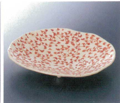
ホ-14712 615704 4,200円 赤絵タコ唐草8.0浅鉢 40入 27×23.5×4.8cm