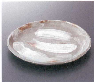
マ-14707 647160 4,460円 粉引刷毛目9.0丸皿 20入 27.2×3cm