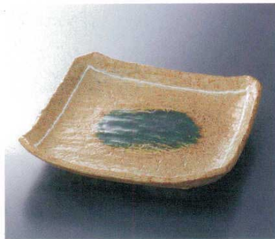
マ-14704 615606 4,500円 古都の香8.0盛皿 40入 23.5×23.5×5cm