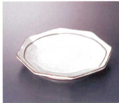
ワ-14708 616003 4,400円 粉引八角和皿 5×6入 21.7×3.5cm