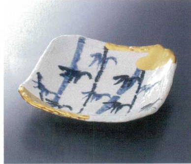
ホ-14702 615609 4,600円 竹林かいらぎ正角深皿 24入 21.8×21.8×5.3cm