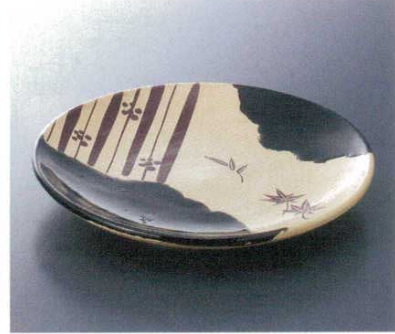
キ-14703 615610 4,600円 黒織部紅葉8.0皿 20入 25×3.5cm