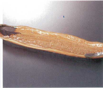
キ-14706 615701 4,400円 黄瀬戸楕円鉢 20入 46×11.3×3cm