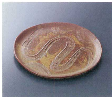
ホ-14710 616004 4,300円 手造り灰釉榊目7.5皿 30入 23.3cm