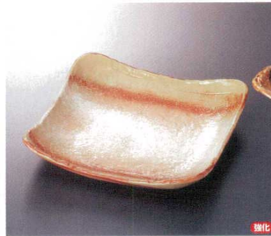
マ-14705 615702 4,500円 春結晶正角10.0皿 30入 23×23×4.5cm