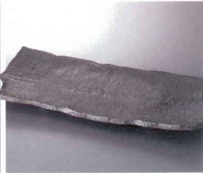
テ-14709 615611 4,400円 炭化土線段12.0皿 10入 36.5×15×3cm