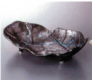
マ-14810 616007 3,740円 黒潮木ノ葉型盛鉢 30入 26.2×15×8.4cm