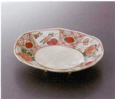
ホ-14807 714807 3,800円 花蝶7.0浅鉢 40×24入 24×4.8cm