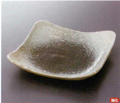
マ-14801 645417 4,120円 織部かすみ正角10.0皿 20入 23×22.5×4.5cm