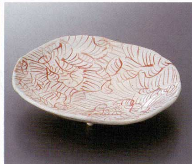
ホ-14808 714808 3,600円 開花7.0浅鉢 40×27入 24×4.8cm