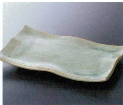
マ-14811 615804 3,520円 白雲四ツ足9.0皿 20入 29×18.5×4cm