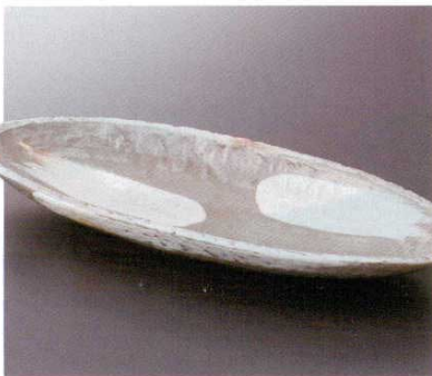
マ-14804 647161 3,980円 粉引刷毛目舟型盛鉢 20入 35.5×14×4cm