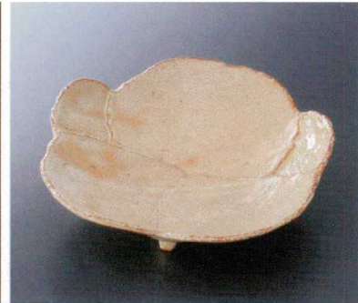
コ-14803 615706 4,000円 梅の花足付平盛鉢 20入 23.5×7.2cm