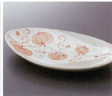
コ-14806 714806 3,800円 赤絵山帰来楕円 Pasta皿(手造り) 30入 30×20×5cm