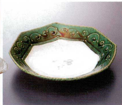
ワ-14805 616006 3,960円 志野織部八角多盛皿(大) 1×24入 24×4.5cm