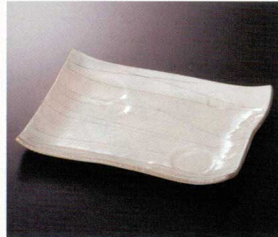
サ-14802 615705 4,000円 ストライプ26中盛皿 20入 26.5×20.7×3cm