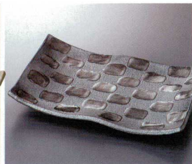
マ-14812 615802 3,520円 黒結晶四ツ足9.0皿 20入 29×18.5×4cm