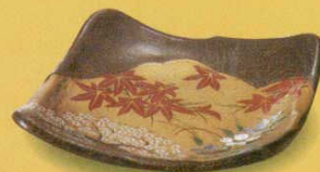
▶P184 ワ-01522 619804 2,400円 聚楽第和皿 5×8入 16.3×16.3×3.5cm