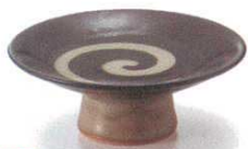
▶P068 タ-01501 606712 2,500円 天目渦潮高台皿 40入 14×4.8cm