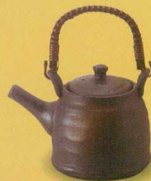
▶P366 サ-01520 639831 2,100円 備前吹民芸土瓶(アミ付) 2×24入 590cc