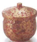
▶P120 ホ-01502 613106 2,000円 金彩葉紋むし碗 80入 7.2×9cm