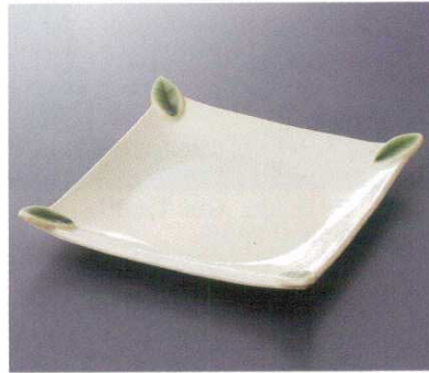
ヒ-15305 715305 1,980円 木の葉盛皿 30入 21.5×3.5cm