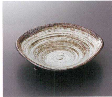
ス-15308 715308 1,850円 白刷毛三ツ足鉢 60入 21.7×5.5cm