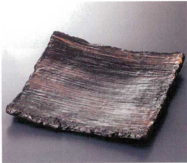
レ-15301 615912 2,100円 加茂川凜正角皿(大) 40入 23.5×23.5×3cm