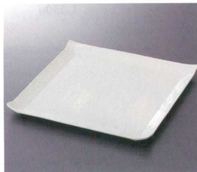
ヒ-15310 715310 1,750円 コヨリ大皿(白) 20入 24.5×2cm