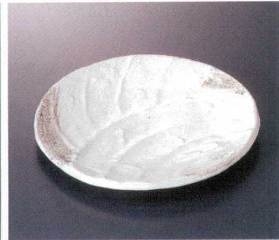
レ-15312 616302 1,700円 蔵間極丸皿 40入 24.5×2.8cm