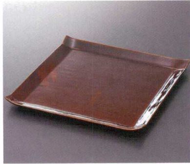
ツ-15302 715302 2,000円 あめコヨリ大皿 40入 24.5×24.5×2cm