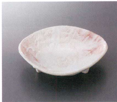
ス-15307 715307 1,850円 桜志野三ツ足鉢 60入 21.7×5.5cm