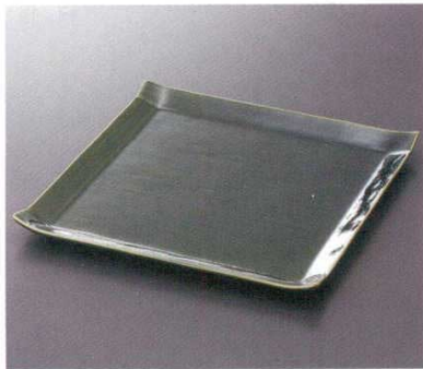
ツ-15304 715304 2,000円 織部コヨリ大皿 40入 24.5×24.5×2cm