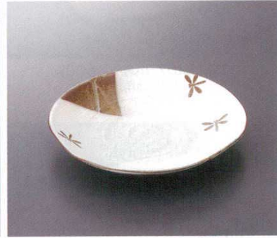
ワ-15309 715309 1,800円 粉引とんぼ盛皿 36入 21cm