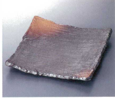
ニ-15303 616212 2,400円 金茶吹角盛皿 30入 23.7×23.1×3cm