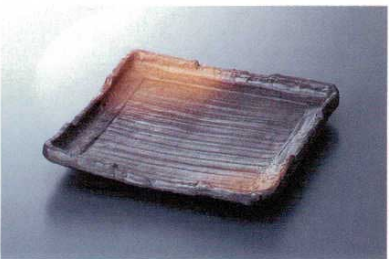
ケ-15413 616404 1,350円 黒備前金茶吹飛鳥19cm正角皿 40入 19×19×3cm