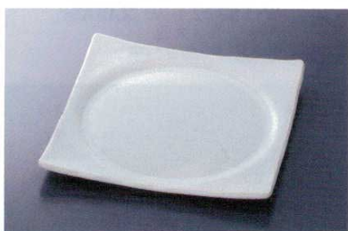
テ-15405 616309 1,600円 粉引白正角盛皿 20入 20.8×20.8×2.3cm