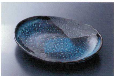
ス-15408 616306 1,590円 青流天目楕円8.0深皿 30入 25.2×21×4cm