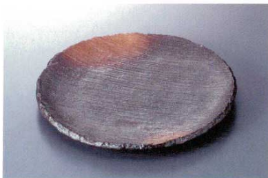
ニ-15401 616208 1,770円 金茶吹8.0丸皿 30入 25.2×2.7cm