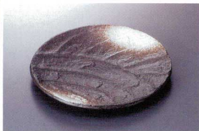
レ-15402 616301 1,700円 白吹天目極丸皿 40入 24.5×2.8cm