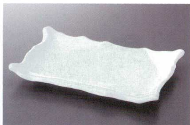
ヤ-15403 614107 1,680円 舞長角皿 20入 26.5×17.5×3.7cm(中国製)