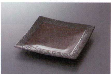
サ-15409 715409 1,550円 錆彩正角皿 30入 21.5×21.5×2cm