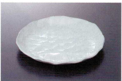
ハ-15412 616812 1,450円 粉引手折 pasta皿 30入 25×2.6cm