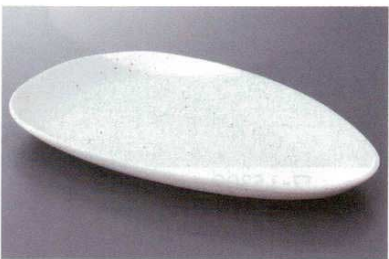
サ-15410 645764 1,430円 白山マロン形32大皿 30入 32.5×18cm