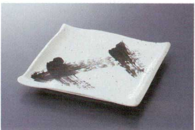
ヒ-15414 715414 1,280円 粉引黒刷毛目正角皿(大) 40入 22.5×22.5×3.2cm