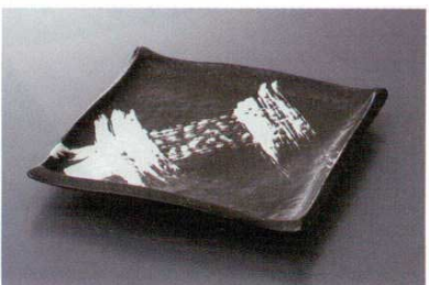
ヒ-15415 715415 1,280円 黒釉白刷毛目正角皿(大) 40入 22.5×22.5×3.2cm