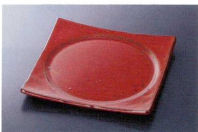
テ-15404 616311 1,600円 鉄砂正角盛皿 20入 20.8×20.8×2.3cm