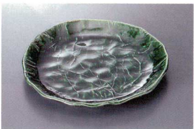
ハ-15411 616312 1,450円 織部手折 pasta皿 30入 25×2.6cm