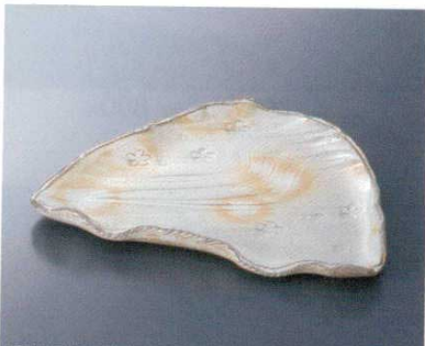
萩粉引印花おにぎり

コ-16214 617403 2,650 円 6.0皿 50入 17.5×3.5cm コ-16215 617604 3,500 円 7.0皿 30入 21×3.5cm コ-16216 617605 5,500 円 9.0皿 15入 26.5×4.2cm