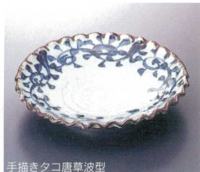
手描き夕コ唐草波型

ス-16713 617822 900円 6.0深皿 50入 19×3.5cm ス-16714 617823 1,300円 7.0深皿 40入 22×3.2cm ス-16715 617824 2,180円 8.0深皿 30入 24.7×3.4cm