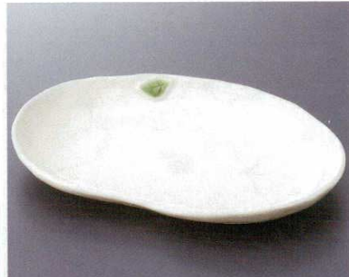
リーフペンダント

ニ-16803 617810 690円 6.0皿 60入 19.8×2.8cm ニ-16804 617811 940円 7.0皿 40入 22.5×2.9cm ニ-16805 617812 1,500円 8.0皿 20入 25.1×3.5cm