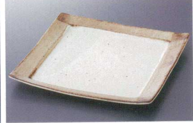
ヤ-17503 717503 2,900円 きなり大皿 30入 24.5×24.5×2.5cm