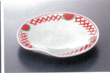
ヤ-17508 618803 2,100円 赤絵7.0皿 30入 21×3cm