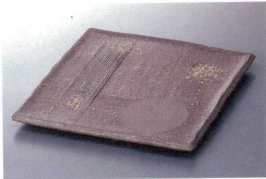
ヤ-17501 618703 2,900円 炭化土ちぎり正角7.0皿 30入 21×21×2.5cm