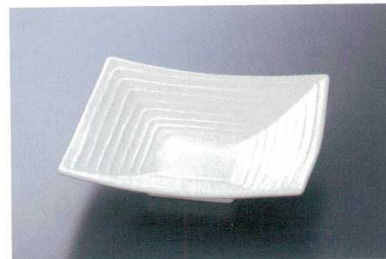
ヒ-17507 618713 2,400円 定窯正角6.0高台皿 60入 18×18×5cm