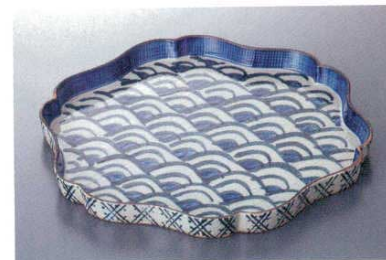
ヤ-17510 618808 2,000円 波画8.0皿 1×24入 23.5×2cm