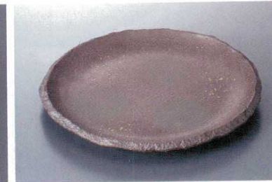
ヤ-17514 618809 1,850円 炭化土ちぎり7.5皿 30入 22.5×2.5cm