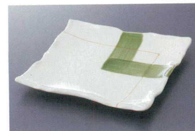
キ-17513 717513 1,860円 重ね格子正角皿 40入 20×20×2.6cm