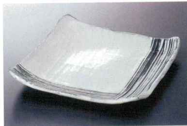
カ-17504 618708 2,550円 粉引刷毛正角皿 30入 21.5×21.5×3.8cm