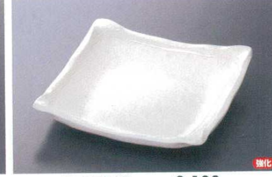
テ-17509 618807 2,100円 NB四方上り角盛皿 30入 19.7×19.7×3cm