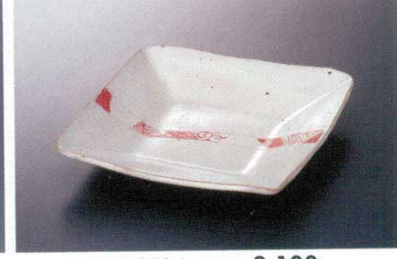
コ-17506 618715 2,100円 赤絵花筏四方皿(手造り) 30入 18.5×18.5×3cm