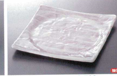
ム-17515 618812 1,700円 紫刷毛正角皿 30入 20.8×20.8×2.2cm