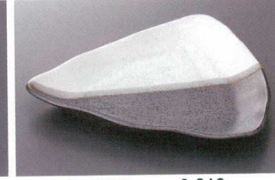
キ-17512 717512 1,860円 塗分三角盛皿 30入 23.7×23.2×2.5cm