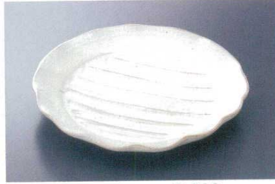
ワ-17502 618709 2,500円 粉引削ぎ目盛皿 5×8入 21.3cm