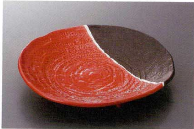
サ-17601 717601 1,700円 赤と黒の7.0皿 40入 21.5×3.7cm