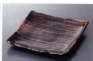
レ-17615 619006 1,300円 加茂川凜正角皿 40入 19×19×2.6cm