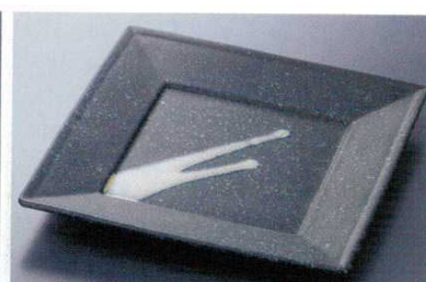
ヒ-17609 618910 1,480円 銀彩藍盛皿 20入 21×21×2.5cm