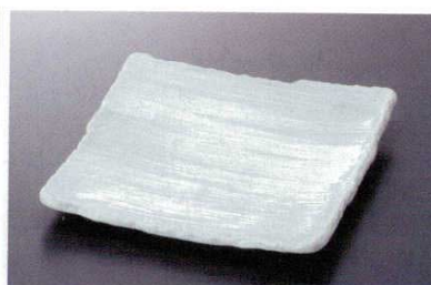
レ-17614 619007 1,300円 堀川凜正角皿 40入 19×19×2.6cm