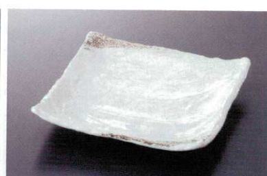
レ-17612 619005 1,300円 蔵間極正角皿 40入 19×19×3.8cm