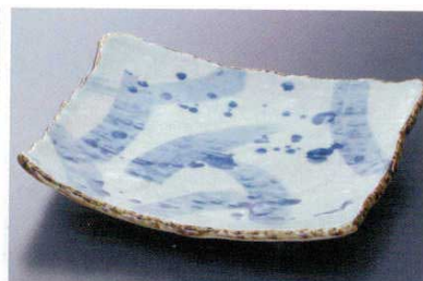
ツ-17608 618905 1,450円 呉須ちらし口変り 40入 22×19×4cm