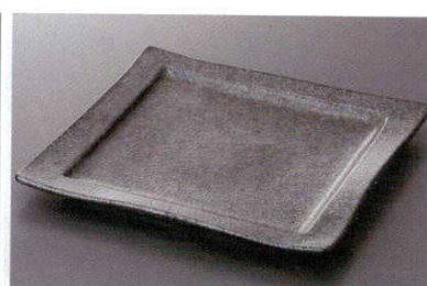
ツ-17606 717606 1,500円 銀黒角中皿 60入 22×18×2.5cm