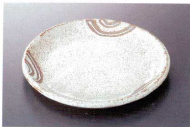
マ-17604 616308 1,650円 粉引木目変り皿 40入 20.7×2.5cm