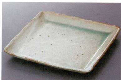
ワ-17613 717613 1,320円 わかかさ角盛皿 40入 22.5×22.5×4.5cm