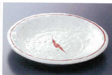
ハ-17605 618815 1,500円 唐辛子7.0皿 40入 23×3.3cm