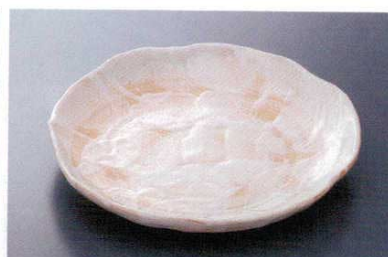
ニ-17611 618907 1,350円 赤志野7.0皿 40入 21.5×21×3.1cm