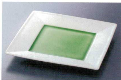
ヒ-17610 618909 1,480円 エメラルド盛皿 20入 21×21×2.5cm