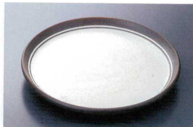
ニ-17602 618901 1,600円 南蛮粉引7.0皿 40入 22.4×3.2cm