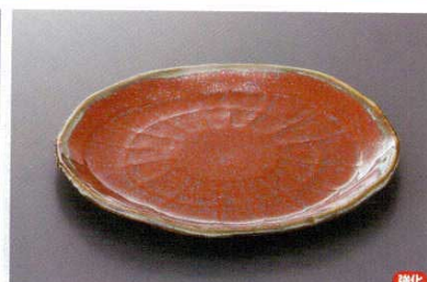
ム-17603 717603 1,600円 朱赤茶流し7.0皿 30入 21.3×2cm