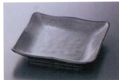
ム-17710 619108 900円 鉄結晶口変り四方皿 40入 18.4×18.4×3.3cm