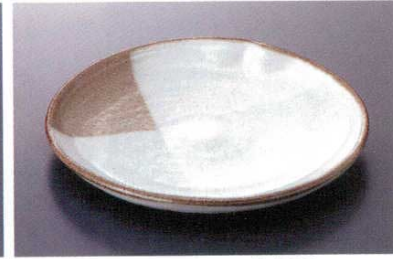
ヤ-17706 619012 1,100円 掛け合せ片口大皿 30入 21.4×19.6×2.8cm