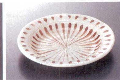
ニ-17714 619114 610円 うず十草7.0皿 40入 21.6×3.2cm