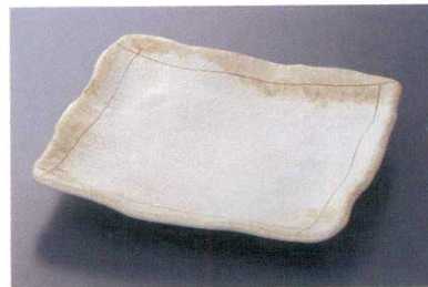
サ-17707 619107 1,050円 初霜四ツ足角皿(大) 40入 20×18×3.5cm