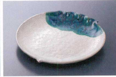
ワ-17702 618914 1,200円 かぶら和皿 5×8入 20.3×19.5×2.5cm