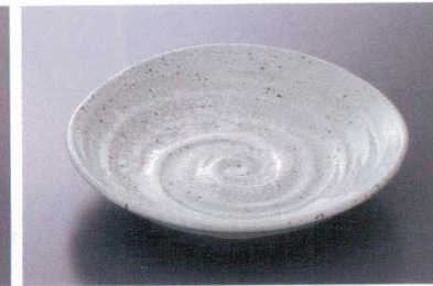
ス-17715 619115 480円 グリーン古染6.8多用皿 50入 20.6×4.2cm