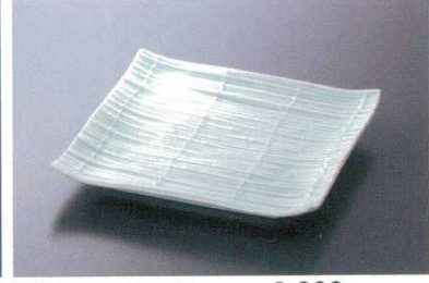
マ-17703 619010 1,200円 青地スタレ正角焼物皿 40入 18×18×2.7cm