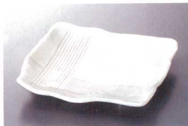
サ-17704 619101 1,130円 粉引柳目四ツ足角皿(大) 40入 20×18×3.5cm