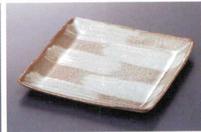
ヤ-17705 619011 1,100円 灰粉引角大皿 30入 20×20×1.8cm