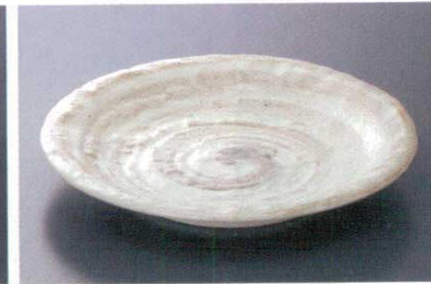
オ-17711 619111 850円 東風石目7.0皿 40入 23×3.5cm