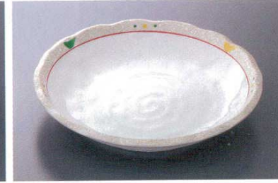
ニ-17712 619113 660円 しなやか7.0深皿 40入 22.3×4cm