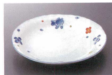
ツ-17713 717713 800円 赤絵花うさぎ7.0皿 40入 21.5×3.5cm