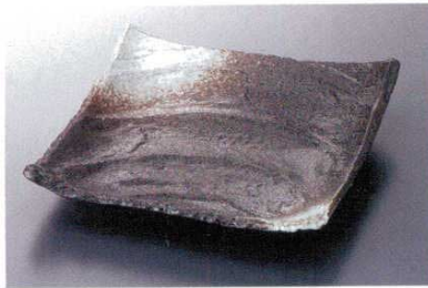
レ-17701 618915 1,300円 白吹天目極正角皿 40入 19×19×3.8cm