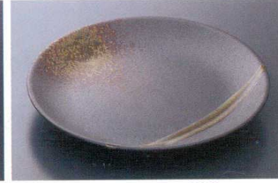
ニ-17709 619110 930円 南蛮吹流し7.0皿 40入 22.9×3.3cm