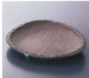
ツ-17905 619308 2,700円 炭化土縄瀧口変り 40入 20.5×18.5×3cm