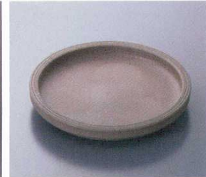
ツ-17908 619306 2,700円 炭化土6.3口変り丸 40入 19×3cm