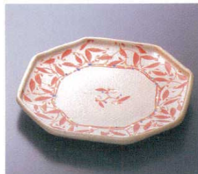
ワ-17913 619309 2,520円 志野赤絵八角中皿 5×8入 20×20×2.5cm