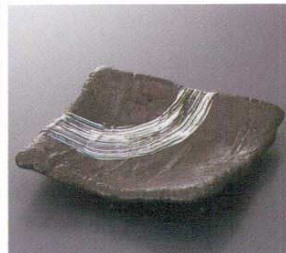
ヤ-17914 717914 2,500円 炭化白刷毛目四角前菜皿 40入 19×18.5×4cm