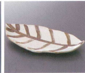
タ-17920 717920 2,200円 手造り朴葉皿(前菜皿) 40入 25.5×12.7×3.5cm