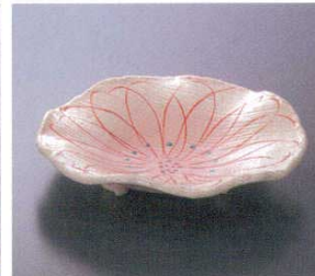
ツ-17911 619315 2,600円 志野菊割中鉢 40入 19×4.5cm