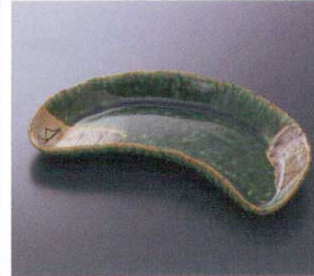
ホ-17903 619219 3,800円 織部半月前菜皿 40入 20×9cm