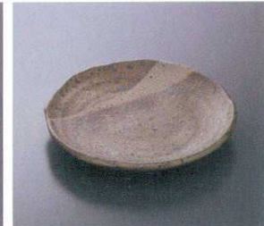
ホ-17916 619405 2,400円 手造り灰釉鉄彩5.5菜皿 60入 17×2.5cm