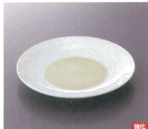
ム-17909 717909 2,650円 黄白唐草彫6.0皿 40入 18.7×2.5cm