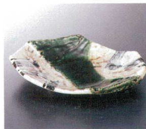
カ-17917 618711 2,350円 織部錆絵変型7.0皿 40入 22×16×3.8cm