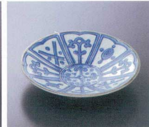
テ-17912 619305 2,600円 染付花泉6.0皿 40入 18.3×4cm