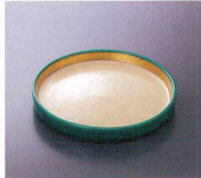
ホ-17902 619217 2,880円 仁清緑交趾金蘭手前菜皿 60入 17.2×2.4cm