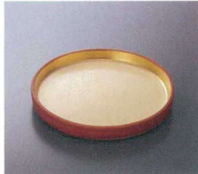
ホ-17901 619218 2,880円 仁清赤巻金蘭手前菜皿 60入 17.2×2.4cm