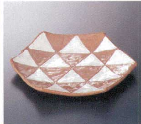
タ-17906 619220 2,700円 幾可紋前菜皿 40入 19.8×17.4×2.5cm