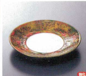
ム-17910 619302 2,600円 鎌倉三彩巾広6.0皿 40入 18.8×3.1cm