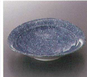
ネ-17907 717907 2,700円 たご唐草ひずみ皿 60入 20.5×19.2×5cm