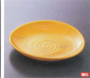
ホ-17904 619307 2,780円 黄交趾6.0前菜皿 30入 19.6×18×3.5cm