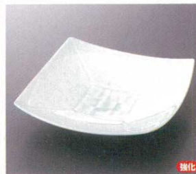
カ-17918 717918 2,300円 青白磁正角6.0高台皿 40入 18.7×18.7×4.7cm