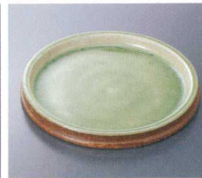
コ-17919 619312 2,380円 灰釉切立6.5丸皿 30入 20×2.3cm