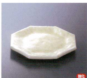
ム-18014 619413 2,000円 高麗八角足付6.0前菜皿 40入 17.6×17.6×1.8cm