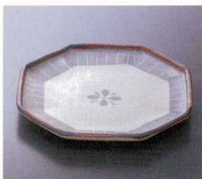
ワ-18009 619410 2,040円 鼠志野八角中皿 5×8入 20×20×2.5cm