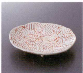
ホ-18011 718011 2,000円 開花6.0浅鉢 60×19入 16×3.8cm