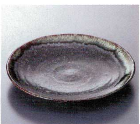
タ-18020 619415 1,800円 天目流し波型7.0皿 60入 20.8×2.8cm