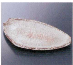
テ-18015 619407 2,000円 御本手7.5盛皿 30入 22.5×13.2×2cm