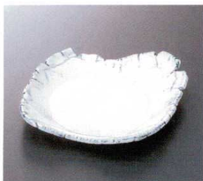
テ-18001 616112 2,150円 ひわれ6.0皿 30入 18.5×17.7×3cm