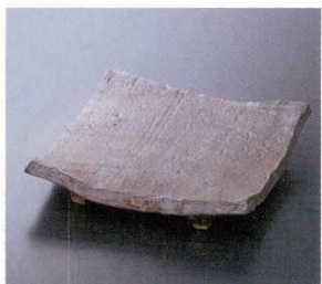
ホ-18007 619408 2,080円 銀彩正角5.5盛皿 40入 18×18×3.7cm