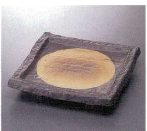
ヒ-18016 606906 2,150円 黒釉砂目正角5.5皿 60入 17.5×17.5×3.2cm