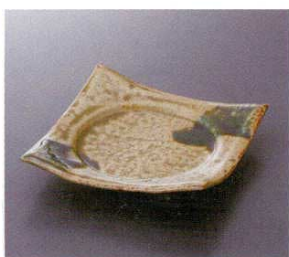
タ-18018 718018 1,950円 風流四ツ足四方皿 30入 16.5×16.2×4.3cm