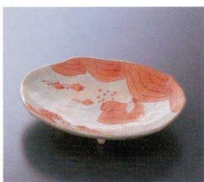
ホ-18017 619417 1,950円 赤絵波千鳥6.0浅鉢 60入 18.6×16×3.8cm