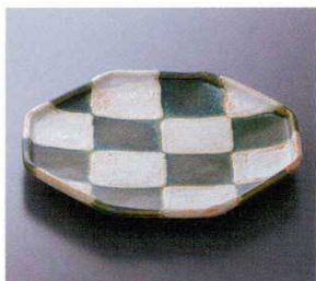
ワ-18006 619412 2,040円 志野織部八角中皿 5×8入 20×20×2.5cm