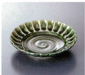
ワ-18003 619404 2,100円 総織部菊割中皿 5×8入 18×4cm