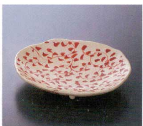
ホ-18019 619418 1,950円 赤絵タコ唐草6.0浅鉢 60入 18.6×16×3.8cm