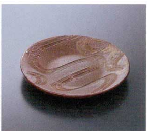
ホ-18012 619319 2,050円 灰釉櫛目6.0前菜皿(手造り) 60入 17.2×2cm