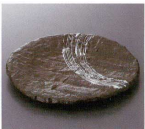
ヤ-18004 718004 2,100円 炭化白刷毛目三ツ足7.0皿 40入 21×2.5cm