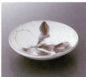
コ-18005 718005 2,100円 粉引墨かぶら6.0鉢 40入 18.5×4.8cm