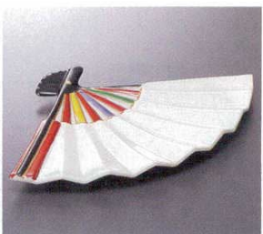
エ-18008 619401 2,040円 錦扇面向附 80入 21.5×15×1.5cm