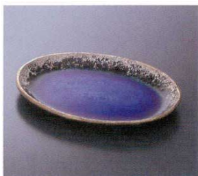
ホ-18010 619510 2,000円 銀麗楕円皿(中) 80入 18.5×13.6×1.8cm