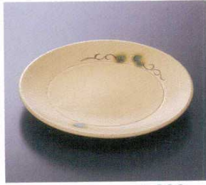
コ-18102 619508 1,800円 黄瀬戸花彫6.5前菜皿 40入 19.5×2.7cm