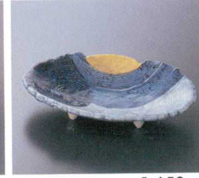
ヒ-18116 619518 1,650円 呉須櫛目6.5小判皿 40入 19×12.5×3.4cm