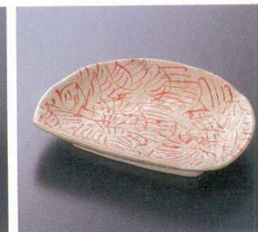
ホ-18118 619603 1,550円 開花半月皿 60入 17.3×13×3.2cm