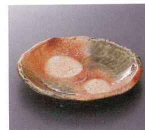
ヤ-18113 718113 1,650円 嵯峨野6.5深皿 60入 19.5×3cm