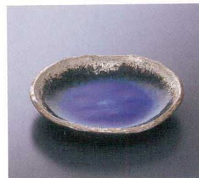
ホ-18105 619504 1,780円 銀麗6.0皿 60入 17×15.6×3cm