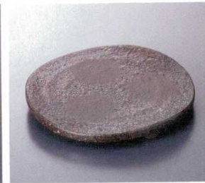
ヤ-18110 619420 1,650円 炭化土ちぎり6.0皿 40入 18.5×2.5cm