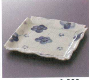
ワ-18103 718103 1,800円 染花隅切り正角皿 40入 18×18×2.2cm