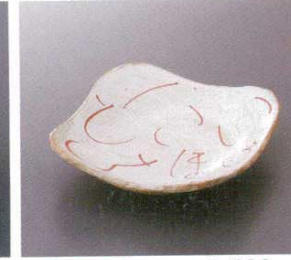
ホ-18120 718120 1,500円 手描きいろは角浅鉢(赤) 60入 16×16×3cm