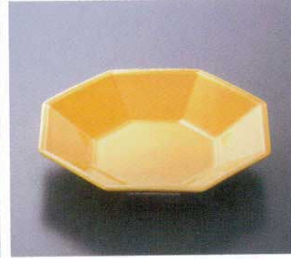
ツ-18107 619515 1,700円 黄釉八角6.0和皿 60入 17.8×3.5cm