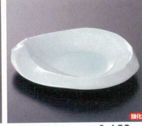
テ-18112 619503 1,650円 青白磁6.5皿 30入 20×6.3×3.2cm