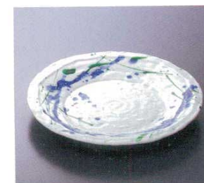
テ-18117 619520 1,540円 砂目2色吹6.0盛皿 40入 19.2×2.8cm