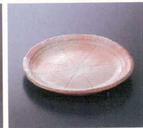
テ-18114 619505 1,620円 御本手5.5盛皿 40入 17.5×3cm