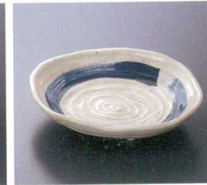
ツ-18119 619606 1,500円 一文字三ツ足和鉢 40入 19×16.5×4cm