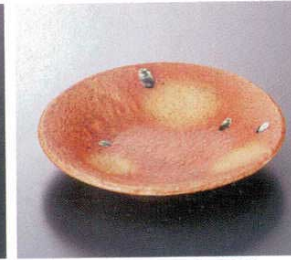
カ-18115 619506 1,580円 南蛮吹水玉6.0深皿 50入 19.2×4.2cm