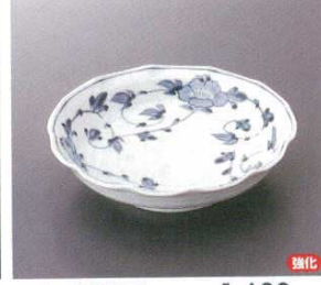
ホ-18108 718108 1,680円 華喜波瀾5.5前菜皿 50入 16.7×4.3cm