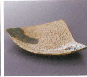
タ-18111 718111 1,650円 風流三角皿(前菜皿) 40入 23.5×17.3×4cm