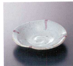
ワ-18109 619514 1,680円 辰砂流し多盛皿(小) 5×12入 17×3.5cm