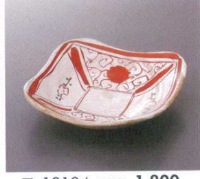
コ-18104 718104 1,800円 赤絵万暦前菜皿 40入 15.8×15.8×3.5cm