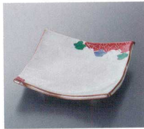
テ-18101 619414 1,850円 雲錦正角7.0盛皿 20入 17×17cm