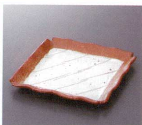
ワ-18203 718203 1,440円 志野かすりパン皿 40入 17.8×17.8cm