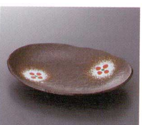
タ-18211 718211 1,400円 花ぐるままゆ型皿(前菜皿) 40入 20.5×14.5×3.4cm