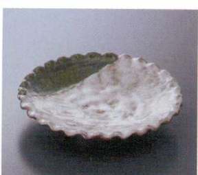
テ-18204 619601 1,450円 織部白雪6.5盛皿 40入 19.5×4cm