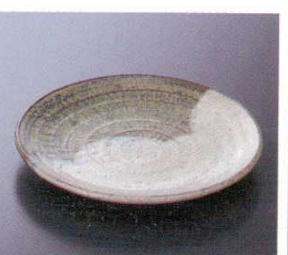
レ-18218 619605 1,400円 黒伊賀6.0皿 60入 18.8×2.6cm