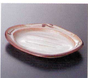
ワ-18206 619516 1,400円 志野唐草取皿 5×12入 20.5×15×2.7cm