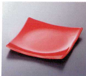
ニ-18201 619513 1,500円 レッド正角皿(中) 40入 17.2×16.7×2.2cm