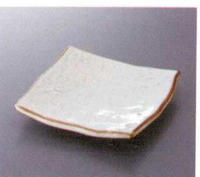
ヤ-18213 644633 1,380円 かすみ野正角天皿 20入 17×17×3.5cm(中国製)