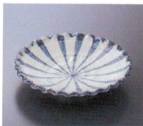
テ-18202 619610 1,450円 古染釉6.5盛皿 40入 19.5×4cm