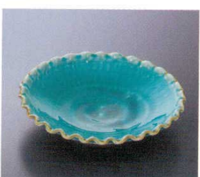
テ-18207 619609 1,450円 マリンプルー6.5盛皿 40入 19.5×4cm