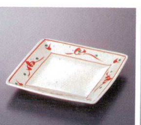
ム-18219 619608 1,350円 粉引赤絵5.0正角皿 50入 16.8×16.8×2.4cm