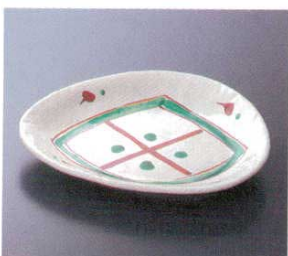
ス-18205 619511 1,400円 手描き菱紋三角中皿 80入 18.9×15.5×3cm