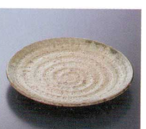
レ-18216 619607 1,400円 若草6.0皿 60入 18.8×2.6cm