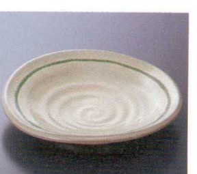
ツ-18220 619612 1,300円 天竜流し6.0皿 40入 20×19.5×3.5cm