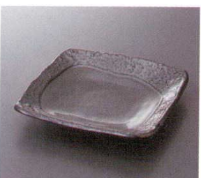
ム-18209 718209 1,400円 鉄結晶石目正角皿 20入 18×18×3cm