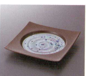
ヒ-18208 718208 1,400円 銀河向附 30入 17.5×3cm