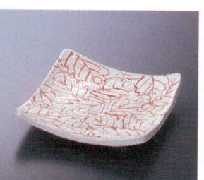
ホ-18215 619611 1,350円 赤絵木の葉正角皿 40入 16.3×16.3×4cm