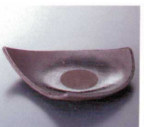
タ-18217 619604 1,350円 ブラックストーン三角皿 40入 19.7×15.2×5.3cm