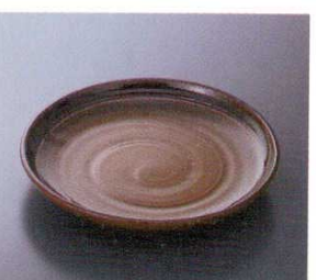
タ-18214 619519 1,380円 伊良保吹6.0丸皿 60入 18.5×3cm