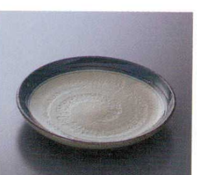
タ-18212 619517 1,380円 灰袖干段6.0丸皿 60入 18.5×3cm