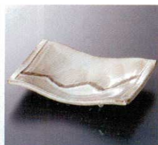
ワ-18402 619803 2,700円 粉引長角銘々皿 5×8入 17.7×12.3×3.5cm