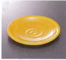
エ-18407 619808 2,280円 黄交趾渦5.0フルーツ皿 60入 15.5×1.7cm