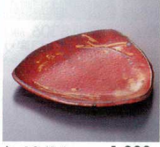
ヤ-18414 619819 1,880円 手造り赤釉三角取り皿 80入 15×14.8×2cm