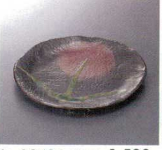
ヒ-18426 619918 1,500円 備前風草紋(手造り)取皿フルーツ皿 80入 16×1.5cm