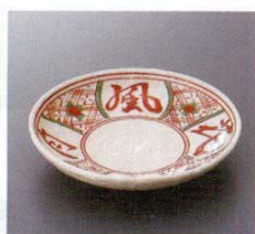
ホ-18405 718405 2,300円 赤絵雪花花5.0皿(手描き) 100入 15×2.8cm