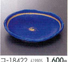
コ-18422 619905 1,600円 青翠蟹紋6.0フルーツ皿 50入 17×15.7×3cm