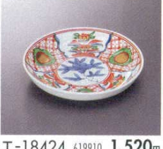
エ-18424 619910 1,520円 万暦草紋深4.8皿 100入 14×2.5cm