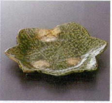
ワ-18429 718429 1,440円 織部金彩楓中皿 60入 18.2×17cm