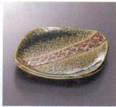
ホ-18409 619811 2,200円 手造り織部小紋足付角中皿 60入 13.5×13×2.3cm