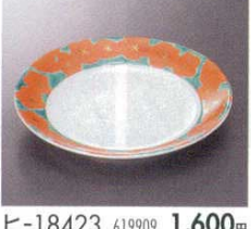
ヒ-18423 619909 1,600円 赤梅5.5フルーツ皿 100入 16.8×2.6cm