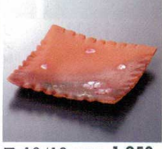
ワ-18412 619817 1,950円 焼厶小花角銘々皿 5×8入 15.3×15.3×2.5cm