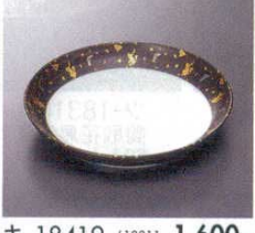
キ-18419 619911 1,600円 金銀彩5.0皿 80入 15.8×2.7cm