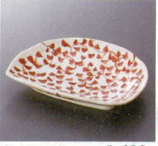
ホ-18427 718427 1,480円 赤絵タコ唐草半月皿 60入 17.3×13×3.2cm