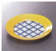
ホ-18401 619802 3,400円 黄交趾七宝5.5フルーツ皿 60入 16.5×2.7cm