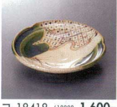
コ-18418 619908 1,600円 織部三ツ押5.0皿(手造り) 40入 15.5×3cm