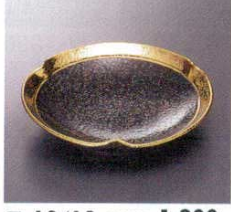
コ-18413 619821 1,900円 南蛮金彩三ツ押5.0皿 80入 15×3.3cm