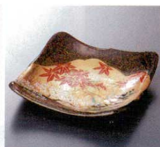
ワ-18403 619804 2,400円 聚楽第和皿 5×8入 16.3×16.3×3.5cm