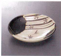
キ-18410 619824 1,980円 黒織部紅葉5.0皿 80入 15.2×3cm