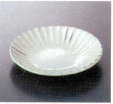
ワ-18430 619921 1,440円 粉引菊割取り皿 5×12入 16cm