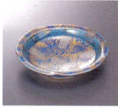
ホ-18406 619807 2,250円 青釉元禄5.0フルーツ皿 120入 15×2.8cm