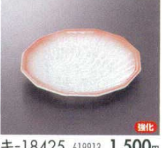
キ-18425 619913 1,500円 ピンク木目フルーツ皿 60入 15×2.3cm