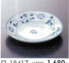
ワ-18417 619829 1,680円 うす染め多盛皿(小) 5×12入 16×3cm