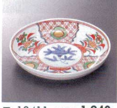
エ-18411 619818 1,940円 万暦草紋深5.5皿 60入 16.5×3cm