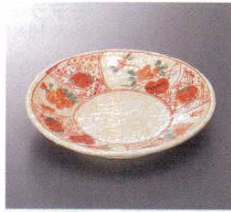
ホ-18408 619812 2,300円 花蝶5.0皿 100入 15×2.8cm