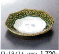
ワ-18416 619904 1,720円 志野織部八角多盛皿(小) 5×12入 16.5×3cm