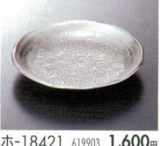
ホ-18421 619903 1,600円 銀彩渦5.0皿 120入 16.3×2.5cm