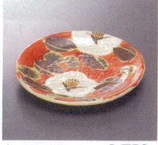
キ-18415 619826 1,750円 赤濃山茶花5.0丸皿 100入 15.5×2cm