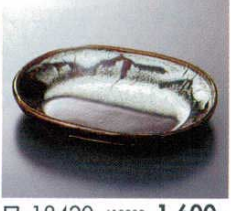
ワ-18420 619902 1,600円 古瀬戸塗分け小判皿 5×16入 17.3×13.5×2.5cm