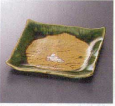
ワ-18428 620002 1,440円 波兎角中皿 5×12入 14.5×14.5×2cm