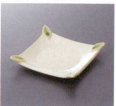
ヒ-19209 719209 680円 木の葉取皿 80入 11.5×2.2cm