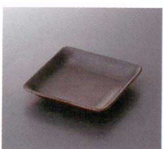
セ-19204 719204 700円 黒釉角取皿 60入 12×12×2.3cm