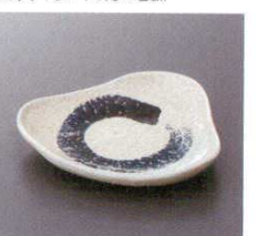
ツ-19225 620838 650円 一文字三角銘々皿 150入 14×12.5×2cm