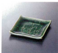
マ-19202 620529 720円 織部芦角銘々皿 150入 11.6×11.6×1.8cm