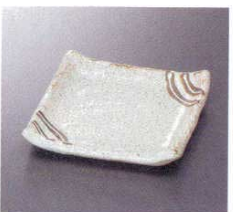
マ-19213 620607 650円 粉引木目角銘々皿 120入 12.5×12.5×2.3cm