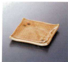
マ-19201 620528 720円 黄瀬戸角銘々皿 150入 11.6×11.6×1.8cm