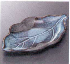
ス-19216 620530 630円 清流天目葉型銘々皿 120入 19.2×11×1.8cm