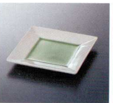
ヒ-19226 620609 630円 エメラルド銘々皿 100入 13.3×13.3×1.7cm