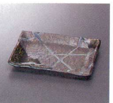
キ-19222 620524 640円 南蛮乱十草長角銘々皿 100入 14.5×11.2×1.8cm