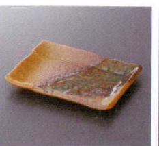
セ-19228 719228 610円 星雲伊賀長角銘々皿 100入 14.5×11.4×1.5cm