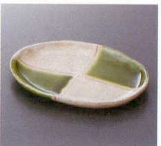
セ-19217 719217 650円 織部市松小判取皿 100入 16.7×12.3×1.6cm