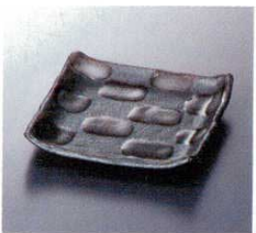
マ-19212 620606 650円 黒結晶角銘々皿 100入 12.5×12.5×2cm