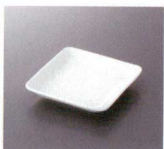
セ-19203 719203 700円 白磁角取皿 60入 12×12×2.3cm