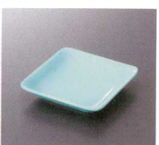
セ-19205 719205 700円 青磁角取皿 60入 12×12×2.3cm