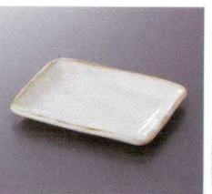
ヤ-19227 644632 630円 かすみ野角取り皿 5×8入 15×11.5×1.2cm(中国製)