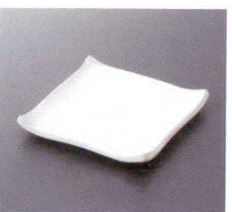
マ-19214 645615 650円 白志野正角銘々皿 120入 12×12×1.8cm