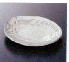
サ-19219 620602 650円 粉引櫛目銘々皿 100入 16×14.5×2cm