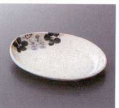
マ-19218 719218 650円 雪化粧藍花5.0小判皿 120入 15.5×12×1.7cm