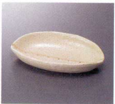
ツ-19208 608917 700円 プチドットトレイ(小) 100入 15×9×2.5cm