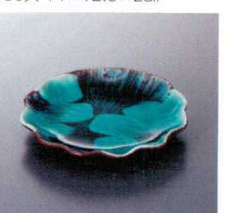
ワ-19230 620617 600円 水中花輪花取り皿 5×16入 13×2.2cm