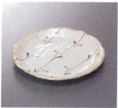
キ-19211 620521 670円 志野芽生丸銘々皿 120入 14×1.7cm