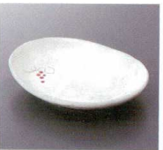
サ-19221 719221 650円 マロンぶどう小判銘々皿 80入 16×1.5×3cm