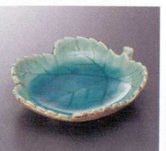
ム-19223 620601 640円 ヒスイ葉形銘々皿 60入 14.7×12.5×3.4cm