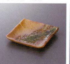
セ-19229 719229 610円 星雲伊賀4.0正角皿 100入 12.6×12.6×2.2cm