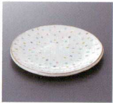
ヤ-19207 719207 750円 花火5.0皿 100入 15.5×1.7cm