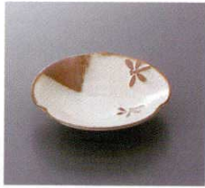
ワ-19206 719206 720円 粉引とんぼ小皿 90入 12.5cm