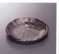
キ-19224 620526 640円 南蛮乱十草銘々皿 100入 13.3×1.8cm