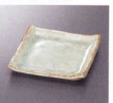
マ-19215 620605 650円 白雲角銘々皿 100入 12.5×12.5×2.3cm