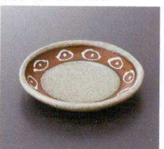
ツ-19210 645959 680円 丸紋4.5皿 100入 13.8×2.2cm