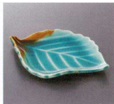
セ-19414 719414 310円 トルコ桑葉銘々皿 150入 16.5×12.5cm