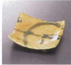
レ-19404 620629 450円 伊良保三ツ足銘々皿 120入 11.8×11.8×3.5cm