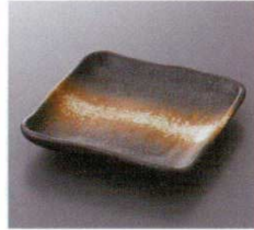
セ-19405 719405 430円 黒備前取皿 80入 14×13.8×2.5cm