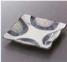
ム-19406 719406 400円 梅祥瑞銘々皿 100入 12.5×12.5×1.5cm