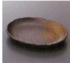
サ-19408 719408 400円 備前吹楕円小皿 100入 13.7×10.5×2cm