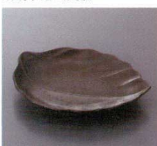
レ-19421 719421 280円 黒水晶木の葉皿 120入 13.7×11×2.3cm