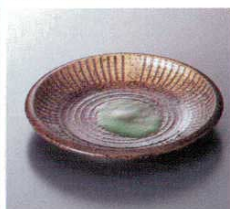
ハ-19419 620719 290円 民芸十草厚口4.0皿 120入 14.2×2cm