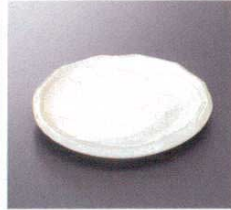
キ-19402 620710 460円 粉引十草銘々皿 100入 13×1.5cm