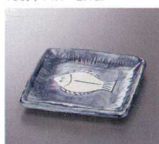
キ-19428 620724 250円 ダミヒラメ銘々皿 120入 12×12×1.3cm