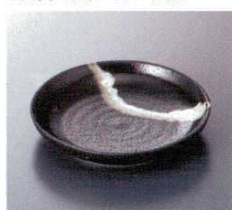
ケ-19425 620716 280円 黒彩銘々皿 120入 13×2cm