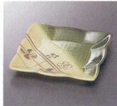
ヒ-19409 620712 380円 織部梅銘々皿 100入 12.8×12.8×1.3cm