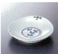
ツ-19416 618415 350円 赤絵萩3.5皿 200入 12×2.3cm