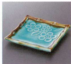
セ-19412 719412 310円 トルコ梅絵銘々皿 150入 12×12×1.5cm