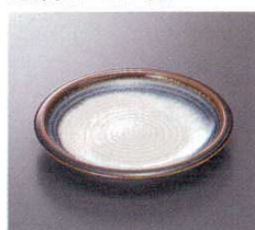
ム-19423 620718 280円 うのふ4.0銘々皿 100入 14.1×2.1cm