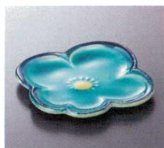
セ-19420 620727 280円 トルコ梅形銘々皿 150入 13.3×13×1.5cm