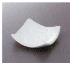
レ-19418 719418 300円 粉引正角小皿 120入 11×11×3cm