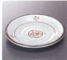
ム-19407 620706 400円 赤絵花4.0銘々皿 120入 14×1.9cm