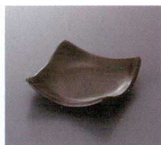
レ-19417 719417 300円 黒水晶正角小皿 120入 11×11×3cm