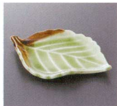
セ-19415 719415 310円 ヒワ桑葉銘々皿 150入 16.5×12.5cm