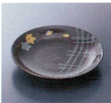
ム-19411 618351 350円 春秋銘々皿 140入 13.6×2.4cm