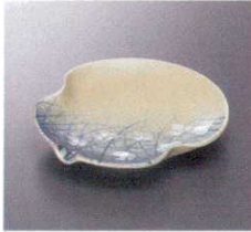
キ-19401 620626 460円 墨吹武蔵野瓢型銘々皿 100入 12.8×12.5×2cm