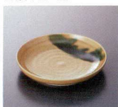
ケ-19424 620717 280円 黄瀬戸銘々皿 120入 13×2cm