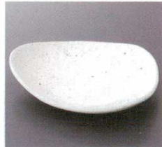
サ-19410 645767 380円 白山マロン形15皿 120入 14.7×12.3cm