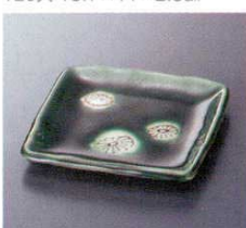
セ-19426 620729 280円 織部菊銘々皿 120入 12.1×12.1×1.5cm