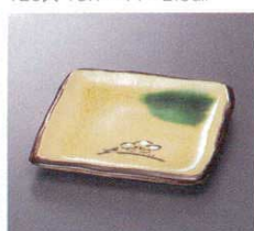
キ-19427 620723 250円 黄瀬戸白梅銘々皿 120入 12×12×1.3cm