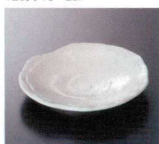
ハ-19430 620722 220円 ハンテンフルーツ皿 100入 15.5×1.7cm