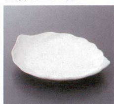
レ-19422 719422 280円 粉引木の葉皿 120入 13.7×11×2.3cm