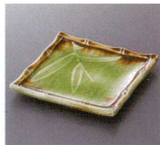
セ-19413 719413 310円 ヒワ笹絵銘々皿 150入 12×12×1.5cm