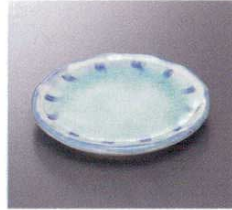
キ-19403 620711 450円 早春銘々皿 120入 13.3×1.5cm