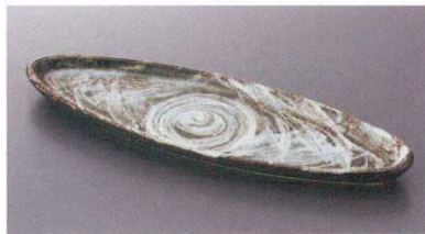
ス-22307 623224 1,030円 白刷毛舟型突出皿 60入 25.6×7.9×1.8cm