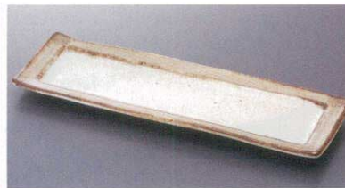
ヤ-22314 722314 1,100円 きなり突出皿 50入 28×9×1.8cm