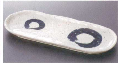
ツ-22303 623413 1,200円 一文字突出皿 40入 28.5×11×2.3cm