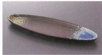
ス-22309 623223 1,020円 しぶき舟型突出皿 50入 25.6×7.9×1.8cm