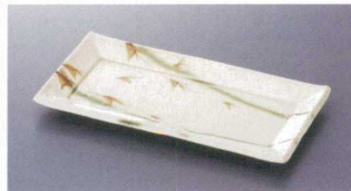
キ-22311 623502 1,050円 草紋織部突出皿 60入 21.8×10.8×1.6cm