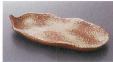
マ-22305 623313 1,000円 備前風木の葉突出皿 60入 24×11×3cm