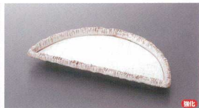
キ-22318 722318 1,100円 茶淵巻半月突出皿 60入 20.5×9.6×2cm