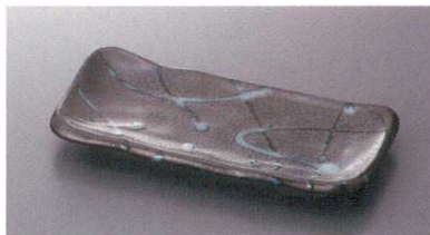
マ-22313 623219 1,000円 黒潮7.0突出皿 50入 21×9.6×2.6cm