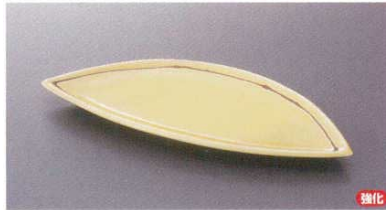
マ-22301 722301 1,170円 黄釉笹型突出皿 80入 22×9×1.5cm