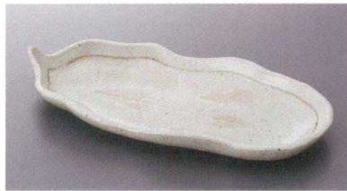
マ-22304 623311 990円 鼠志野木の葉突出皿 60入 24×11×3cm