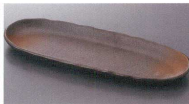
ハ-22317 623423 1,050円 備前風長小判皿 60入 28.7×9.7×2cm