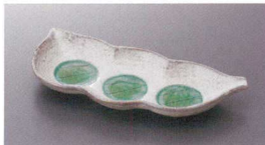
ワ-22310 623305 900円 えんどう突出皿 5×12入 22×9.5×2.5cm