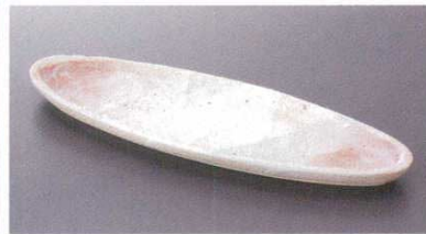
ス-22308 623222 1,020円 桜志野舟型突出皿 60入 25.6×7.9×1.8cm