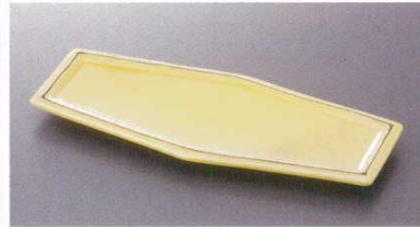
マ-22302 722302 1,140円 黄釉錆筋突出皿 60入 24.2×10.2×1.5cm