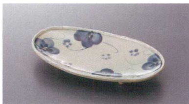
ワ-22316 722316 1,200円 染花足付楕円皿 60入 20.5×11×3cm