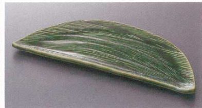
ワ-22312 623403 1,100円 織部半月皿 5×10入 26.7×10.7×1.7cm