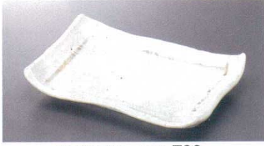
サ-23303 624213 700円 粉引ライン波形焼物皿 40入 20×14×3.8cm