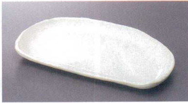
ハ-23305 624308 690円 白粉引半月焼物皿 60入 22×13×2cm