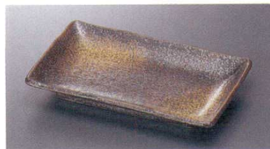
ハ-23316 624314 430円 黒油滴焼物皿 60入 20×12.7×2.8cm