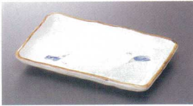
セ-23301 624210 750円 茄子7.0焼物皿 50入 20.7×13.8×2.6cm