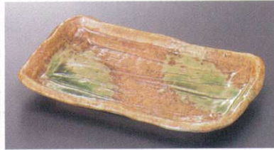
ケ-23315 624306 450円 織部吹削ぎ焼物皿 60入 21×13×2cm