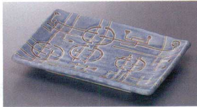
ケ-23311 624209 590円 撥水新唐草7.0焼物皿 40入 21×14.5×2.5cm