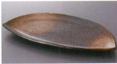
サ-23308 723308 650円 備前吹半月皿 40入 27.5×12.5×2cm