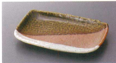
キ-23310 624533 610円 三袖7.0焼物皿 40入 19.8×13.3×2.5cm