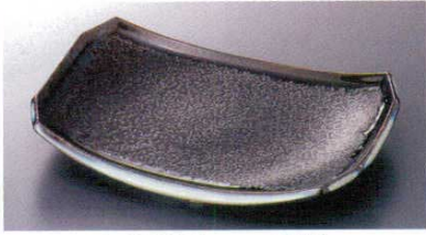
ム-23302 624018 740円 緑彩長角8.0皿 40入 21.8×14.9×3.6cm