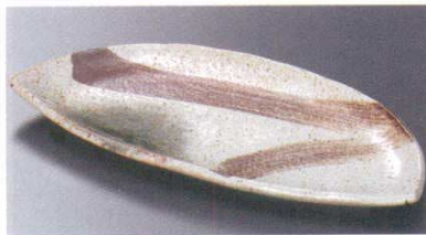
ヤ-23307 623815 680円 錆刷毛半月皿 50入 28×13×2.7cm