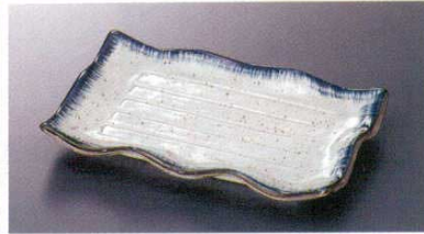
ツ-23318 624311 400円 古染細十草焼物皿 60入 20.5×12.8×2.7cm