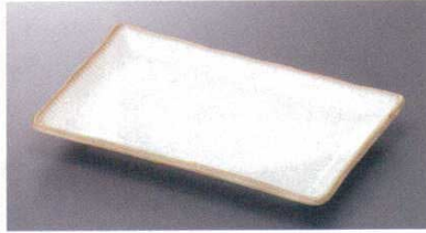
ス-23312 624301 580円 錆ボカシ7.0長角皿 40入 20.6×13.3×3.5cm