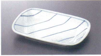
マ-23306 624215 690円 ストライプ小判皿 80入 18.8×12.8×2.2cm