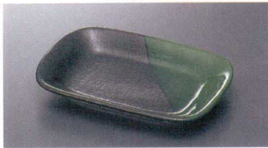
マ-23304 624211 690円 織部塗分小判皿 80入 18.8×12.8×2.2cm