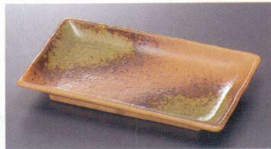
ハ-23317 624310 430円 伊賀長角焼物皿 50入 21×13×2.8cm