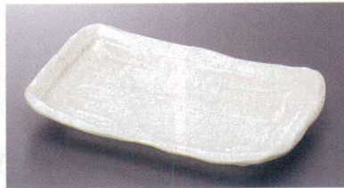
ハ-23314 624313 520円 白釉削ぎ7.0焼物皿 60入 21×13×2.8cm