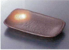
セ-23418 624418 450円 おぼろ備前5.0長角皿 80入 17.5×10×2cm