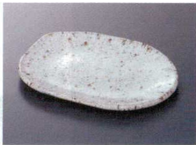
キ-23410 624407 590円 樹氷楕円取皿 60入 17×12.5×1cm