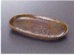
セ-23424 624424 400円 伊賀織部おかず皿 120入 18×10.1×2cm