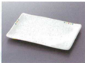
マ-23416 723416 400円 点あそび6.0長角皿 80入 18×12×1.8cm