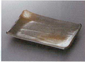
レ-23419 624413 560円 白吹天目串皿 60入 16×11×2.5cm