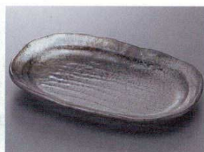
ツ-23408 624405 600円 南蛮白雪小判6.0皿 60入 19.5×13×2cm