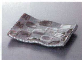
マ-23402 619704 1,000円 黒結晶前菜皿 60入 17×12×2.8cm