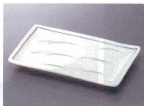
セ-23407 624410 610円 武蔵野6.0長角皿 80入 18.3×11.5×2cm