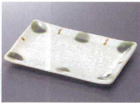
マ-23414 624415 400円 淵織部十草6.0長角皿 80入 18×12×1.8cm