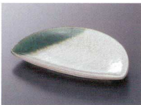
ニ-23405 624404 680円 カイヤギ織部半月銘々皿 60入 18×11.4×2.2cm