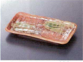
ケ-23422 624421 420円 伊賀織部長角6.0皿 70入 18×9×2cm