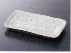
ケ-23421 624423 420円 白マット長角6.0皿 70入 18×9×2cm