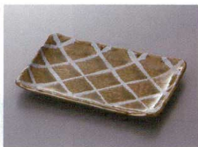
セ-23406 723406 630円 灰釉カゴメ6.0長角皿 100入 17×11.5×1.8cm