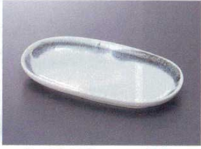
セ-23423 624422 400円 御深おかず皿 120入 18×10.1×2cm