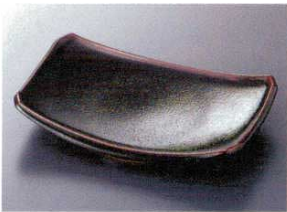
ヒ-23409 624402 600円 ゆず天目長角6.0皿 60入 18.5×12×3.3cm