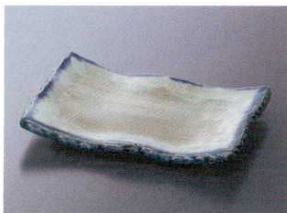
マ-23401 619707 1,000円 御深井前菜皿 60入 17×12×2.8cm