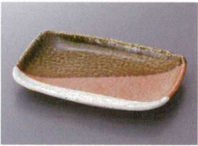
キ-23413 624532 400円 三釉6.0焼物皿 60入 17.5×11.8×2cm