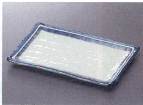
キ-23415 624414 400円 洩ライン6.0長角皿 80入 17.5×11.8×1.3cm