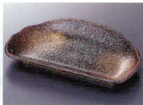
ハ-23411 624312 430円 黒油滴半月皿 50入 21×13.2×2.5cm