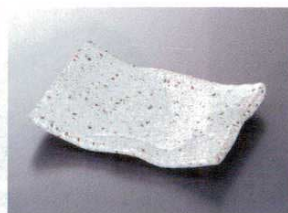
キ-23403 624403 880円 樹氷四ツ足皿 80入 16.7×11.6×2.5cm