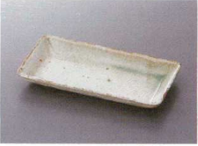
ワ-23417 723417 840円 わかくさ長角取り皿 80入 17×8.5cm