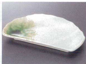
ツ-23412 624317 400円 若草半月焼物皿 60入 21×13×2.5cm