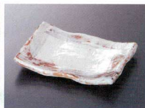
キ-23404 624401 880円 ねずみ志野6.0四ツ足皿 40入 17×11.5×2.5cm