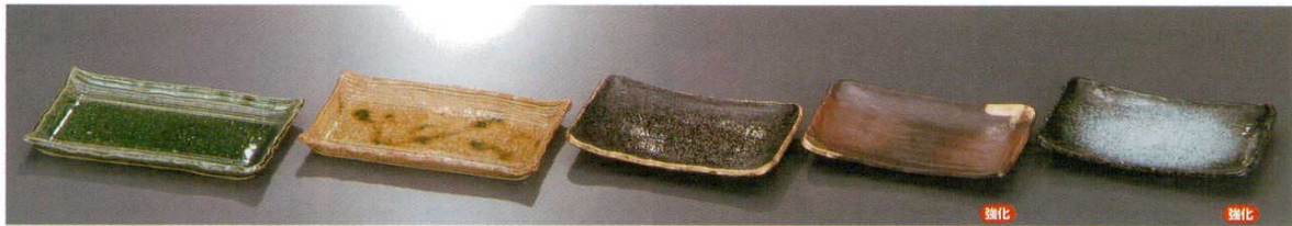
ホ-24001 724001 1,420円 ホ-24002 724002 1,420円 コ-24003 625001 1,450円 コ-24004 625002 1,180円 キ-24005 625005 920円 織部角銘々皿 120入 17×11×2cm 黄瀬戸角銘々皿 120入 17×11×2cm 南蛮金彩5.5長角皿 80入 15.8×11×2cm 焼締雲錦5.5長角皿 80入 15.8×11×2cm 雲海5.5長角皿 80入 16×11.3×2.2cm