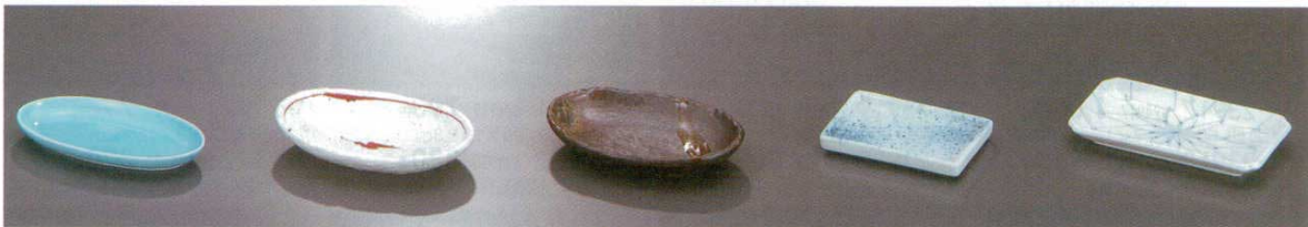
ウ-24016 621103 620円 ハ-24017 620825 820円 ニ-24018 625029 580円 ウ-24019 724019 540円 マ-24020 625016 480円 トルコ楕円小皿 200入 13.5×7.1×1.7cm 唐辛子小判小皿 100入 14.5×9.3×2.5cm 南蛮吹流し石目小判皿(小) 100入 14.2×9.2×2.3cm 吹墨長角小皿 200入 10.2×7.1×2.5cm 書網のり皿 150入 14×8×1.7cm