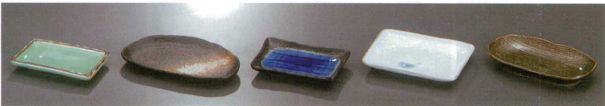
ハ-24026 625020 430円 セ-24027 724027 430円 オ-24028 625024 420円 セ-24029 625023 400円 ハ-24030 724030 360円 ヒスイのり皿 160入 12.6×8×1.5cm 黒備前半月皿小 100入 18.8×10.7×2cm 深海(ブルー)のり皿 100入 13.5×9.5×2.5cm 茄子のり皿 100入 15.2×11.8×2cm 窯変織部線筋17cm取皿 80入 16.5×9.5×2cm