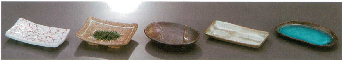
ホ-24006 625008 980円 マ-24007 625006 850円 ニ-24008 625030 720円 ヤ-24009 625014 700円 セ-24010 724010 580円 赤絵木の葉のり皿 80入 15.5×9.3×3cm 古都の香のり皿 100入 15×12.3×3.5cm 南蛮吹流し石目小判皿(中) 80入 16×11.8×2cm 灰粉引長角皿 80入 17×8.8×1.7cm オーシャントルコ半月皿(小) 80入 18×10.4×1.8cm