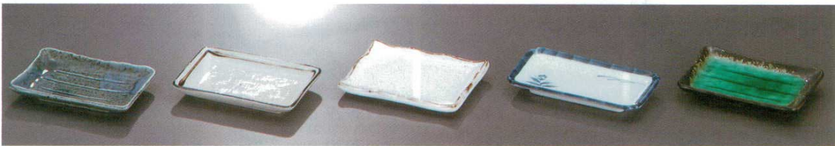
ム-24021 625025 460円 マ-24022 625021 450円 マ-24023 625022 450円 セ-24024 724024 440円 ニ-24025 724025 440円 青碧のり皿 120入 13.5×9.3×2cm 錆一本線のり皿 150入 14.2×9.4×2.2cm 潤錆乳白のり皿 120入 14×10.8×1.6cm 桔梗のり皿 120入 15.5×8.3×2cm 深海取皿 60入 14×8×2.4cm