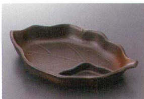
ス-24122 625316 1,000円 備前葉型仕切皿 50入 21.8×12.7×2.8cm