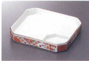
セ-24110 625109 860円 伊万里7.0仕切皿 40入 17×15×3cm