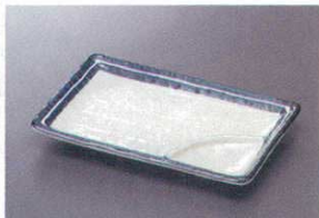
キ-24121 625124 400円 瀏ライン6.0仕切皿 80入 17×11×2cm