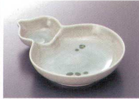
テ-24104 625104 1,020円 梅ビードロひさご仕切鉢 40入 20.5×16×4.3cm