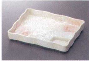
ス-24105 625105 1,100円 桜志野長角仕切皿 40入 18×14.3×2.8cm