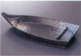
ス-24111 625119 1,540円 しぶき舟型仕切皿 20入 26.4×11.5×3cm