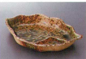
ス-24123 625317 970円 伊賀の里葉型仕切皿 30入 21.6×13.3×3.2cm