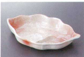
ス-24124 625318 970円 桜志野葉型仕切皿 40入 21.6×13×3cm