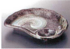
ス-24101 625101 1,430円 白刷毛貝型仕切皿 30入 21.5×17×3.7cm