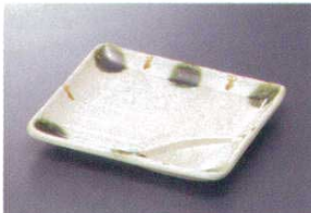
マ-24116 625121 580円 瀏織部十草7.0仕切皿 80入 17.3×15.2×2.5cm