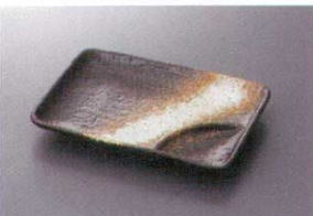
セ-24119 724119 430円 黒備前仕切付6.0皿 60入 17.5×11.9×2.2cm