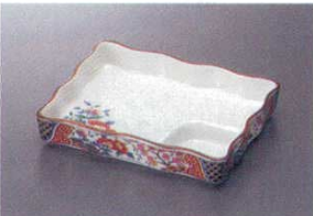
ス-24115 625114 800円 京友禅波型仕切皿 50入 15.6×12×3cm