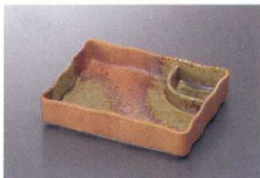
ハ-24118 625116 520円 伊賀仕切皿 60入 14.8×11.7×3cm