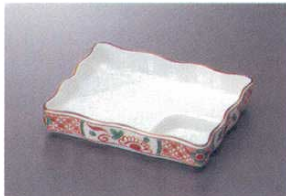
ス-24114 625113 800円 赤絵祥瑞波型仕切皿 50入 15.6×12×3cm