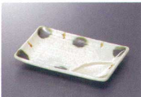
マ-24120 625123 400円 瀏織部十草6.0仕切皿 80入 17.3×11.3×2cm