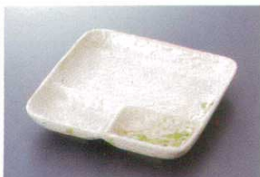
セ-24125 724125 860円 ビードロ仕切付正角皿 40入 17.5×16.8×3cm