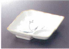
キ-24103 625103 1,300円 武蔵野扇型仕切皿 40入 15.8×15.8×3.8cm