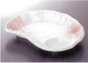
ス-24102 625102 1,430円 桜志野貝型仕切皿 30入 21.5×17×3.7cm