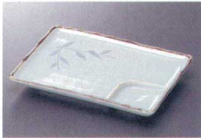
ス-24112 625118 700円 グレー芦仕切皿 40入 18.2×13.2×2.4cm