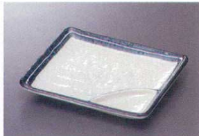
キ-24117 625122 570円 瀏ライン7.0仕切皿 60入 17×14.8×2cm