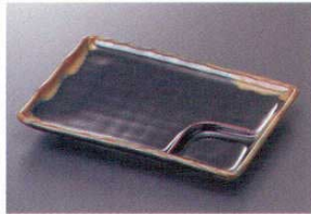
ス-24113 625117 700円 天目茶流し7.0仕切皿 50入 18.2×13×2.2cm