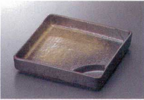
ハ-24106 625106 1,000円 伊賀天目仕切皿 40入 16.5×16.5×3cm