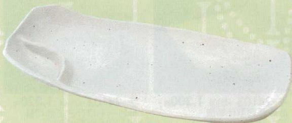
ニ-24201 625201 1,100円 白粉引仕切トレー 20入 33.7×15×4.3cm