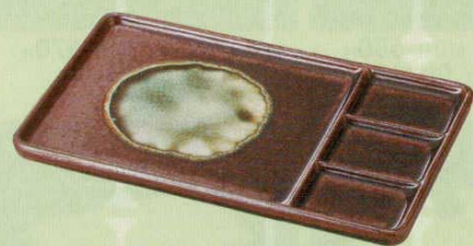
マ-24208 625210 1,700円 錆ガラス流仕切皿 60入 22.3×13.7×1.5cm