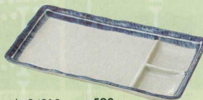
キ-24212 625214 590円 漉ライン仕切付串皿(小) 60入 22.4×12.3×2cm