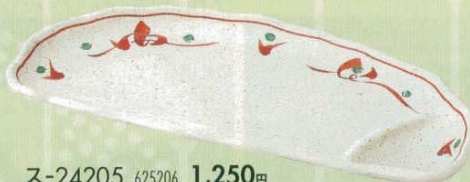
ス-24205 625206 1,250円 粉引赤絵半月仕切皿 30入 27.7×12×2.9cm