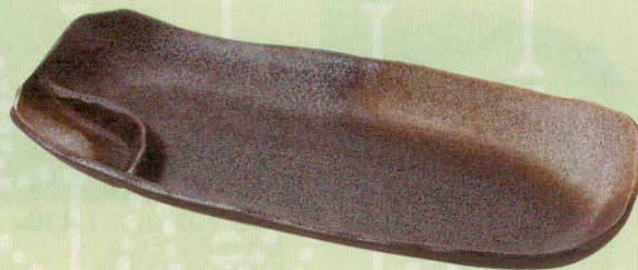
ニ-24202 625202 1,100円 黒水晶仕切トレー 20入 33.7×15×4.3cm