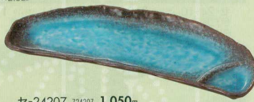
セ-24207 724207 1,050円 オーシャントルコ半月多用皿 30入 30.8×11.5×2.4cm