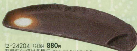
セ-24204 724204 880円 黒備前仕切付多用皿 30入 31.5×12×2.3cm