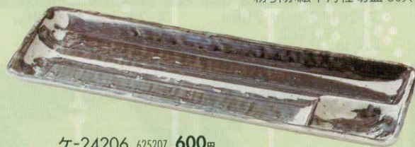
ケ-24206 625207 600円 グレー刷毛11.0仕切皿 50入 33×10.3×2.3cm