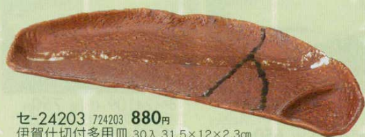
セ-24203 724203 880円 伊賀仕切付多用皿 30入 31.5×12×2.3cm