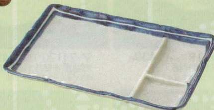
キ-24210 625212 840円 漉ライン仕切付串皿(大) 40入 22.5×14.8×2.3cm