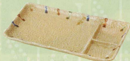
キ-24211 625215 590円 黄瀬戸水玉仕切付串皿(小) 60入 22.4×12.3×2cm