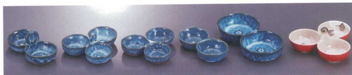
マ-29507 630310 980円 マ-29508 630309 980円 マ-29509 630311 930円 マ-29510 630312 930円 マ-29511 630313 1,170円 キ-29512 630301 1,820円 青三島手付二品皿 青三島手付三品皿 青三島三品皿 青三島二品皿 青三島二品皿(大) 赤濃山茶花三品盛 2×30入 15×7.6×2.8cm 2×30入 14.2×14.2×3cm 2×30入 14.2×14.2×3cm 4×20入 15×7.6×2.8cm 60入 20.5×10.5×3.7cm 40入 16×16×6.5cm