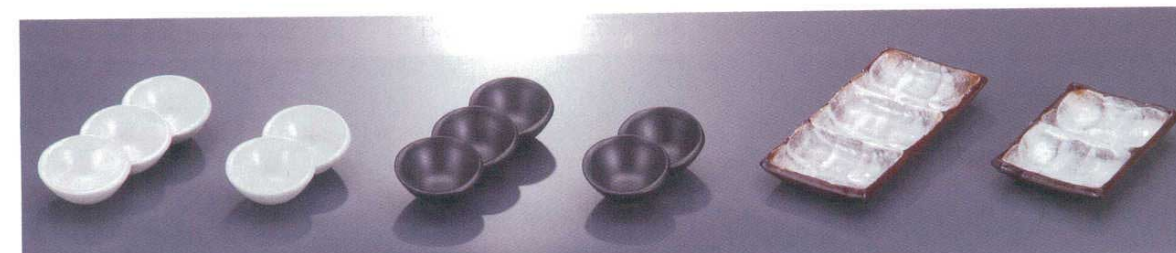
レ-29525 729525 1,050円 レ-29526 729526 720円 レ-29527 729527 1,050円 レ-29528 729528 720円 セ-29529 729529 950円 セ-29530 729530 720円 白マット3連葉味皿 白マット2連葉味皿 黒マット3連葉味皿 黒マット2連葉味皿 備前志野三品皿 備前志野二品皿 60入 16.3×6.7×3.5cm 120入 11.3×6.7×3.5cm 60入 16.3×6.7×3.5cm 120入 11.3×6.7×3.5cm 90入 19.2×9×2cm 120入 13×9×2cm