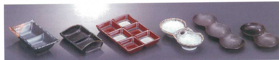
ス-29519 630323 820円 ム-29520 630324 490円 マ-29521 630221 1,400円 キ-29522 630325 580円 ヒ-29523 729523 850円 ヒ-29524 729524 650円 雅二品皿 緑彩葉味皿 錆ガラス流六品皿 ウノフ貝型二品皿 だんご三品皿 だんご二品皿 60入 15.4×8.7×4.2cm 60入 12.9×8.5×3.6cm 60入 18.5×12.3×2.3cm 80入 18×8.9×3.4cm 80入 23.8×8×2cm 100入 15.5×8×2cm