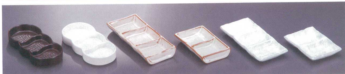
テ-29501 630303 980円 テ-29502 630304 980円 ヤ-29503 644631 830円 ヤ-29504 644630 540円 セ-29505 729505 880円 セ-29506 729506 680円 錆結晶三品皿 粉引三品皿 かすみ野竹節三ツ切 かすみ野竹節二ツ切 白刷毛目三品皿 白刷毛目二品皿 60入 18.6×8.4×2.6cm 60入 18.6×8.4×2.6cm 5×6入 20×9×2.5cm(中国製) 5×8入 13.5×8.5×2.5cm(中国製) 90入 19.2×9×2cm 120入 13×9×2cm