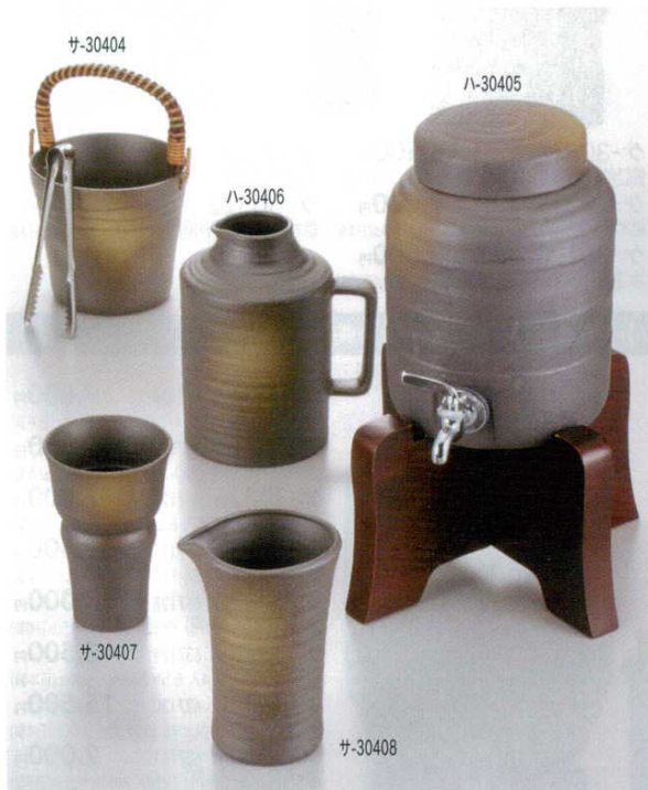
サ-30404 630810 2,100円 備前吹アイスパール 1×40入 12.5×11.8cm ハ-30405 630819 9,800円 備前吹焼酎サーバー(台付) 1×8入 20×15×34cm・2400cc ハ-30406 630808 2,300円 備前吹手付水差 1×30入 14.5×10.5×17.8cm・1200cc サ-30407 630818 750円 備前吹焼酎カップ(大) 6×12入 8.8×13.5cm・320cc サ-30408 630809 1,300円 備前吹水差 1×40入 8.8×14.8cm・500cc