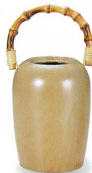
ケ-30402 632202 3,800円 茶二合冷温酒器 1×12入 350cc