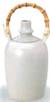
ケ-30403 632203 3,800円 白二合冷温酒器 1×12入 350cc