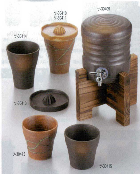
サ-30409 730409 4,500円 備前吹ファミリーサーバー 1×12入 1000cc ツ-30410 630812 650円 伊賀果実しほり 100入 11.5×3cm ツ-30411 630811 850円 伊賀焼酎カップ 10×6入 9.5×12.2cm・450cc ツ-30412 630806 650円 伊賀焼酎(小) 100入 9×9cm・280cc ツ-30413 630814 650円 備前果実しほり 100入 11.5×3cm ツ-30414 630813 850円 備前焼酎カップ 10×6入 9.5×12.2cm・450cc ツ-30415 630807 650円 備前焼酎(小) 100入 9×9cm・280cc