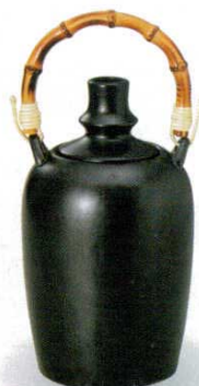
ケ-30401 632201 3,800円 黒二合冷温酒器 1×12入 350cc