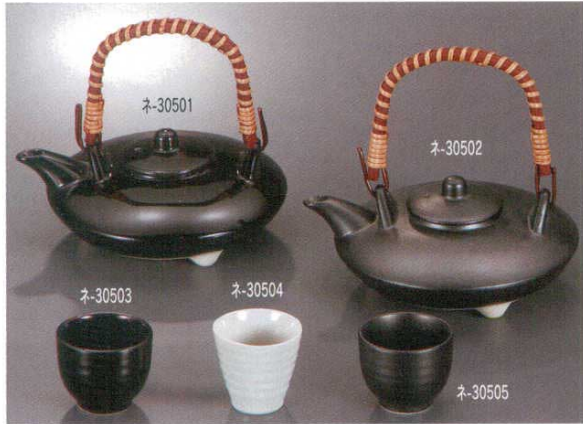
ネ-30501 630905 1,550円 黒ジヨカ 6×8入 320cc ネ-30502 630902 1,550円 黒マットジヨカ 6×8入 320cc ネ-30503 630904 180円 黒釉盃 40×10入 5.5×4.6cm ネ-30504 630932 180円 白六兵盃 50×8入 5×5cm ネ-30505 630901 180円 黒マット盃 40×10入 5.5×4.5cm