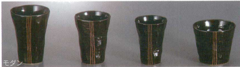
モダン ハ-30524 630923 580円 黒手折焼酎カップ 10×6入 8.5×11.8cm・300cc ハ-30525 630926 450円 黒手折タンブラー 10×8入 8×10.5cm・260cc ハ-30526 630925 400円 黒手折一口カップ 10×12入 7×10cm・180cc ハ-30527 630924 450円 黒手折ロック 80入 9.3×8cm・260cc