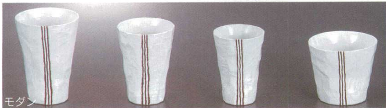
モダン ハ-30520 630923 580円 白手折焼酎カップ 10×6入 8.5×11.8cm・300cc ハ-30521 630926 450円 白手折タンブラー 10×8入 8×10.5cm・260cc ハ-30522 630925 400円 白手折一口カップ 10×12入 7×10cm・180cc ハ-30523 630924 450円 白手折ロック 80入 9.3×8cm・260cc