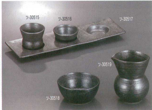
ツ-30515 730515 600円 銀黒玉冷酒杯 150入 6×6cm ツ-30516 730516 400円 銀黒盃 200入 6.3×3.5cm ツ-30517 730517 1,500円 銀黒利き酒皿 100入 29×9.5×2cm ツ-30518 730518 600円 銀黒はかま 90入 9.7×4.5cm ツ-30519 730519 1,400円 銀黒玉冷酒器 10×6入 8.7×7.5×10.5cm・360cc