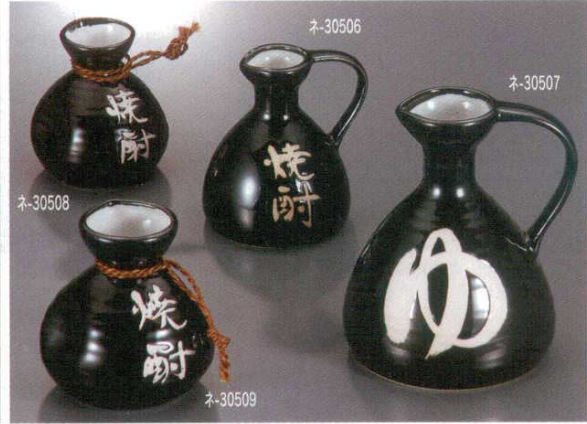
ネ-30506 630928 800円 焼酎2号ポット 10×8入 9×11cm・250cc ネ-30507 630929 1,350円 お湯割3号ポット 1×24入 12×15.5cm・720cc ネ-30508 630930 500円 焼酎1号金着徳利 10×9入 240cc ネ-30509 630931 650円 焼酎2号金着徳利 10×8入 360cc