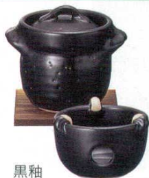
黒釉 ヨ-34413 635712 2,700円 一人用炊きご飯釜 1×20入 9.5×9.5×9.5cm ヨ-34414 635713 2,200円 一人用コンロ 1×24入 10×10×7cm