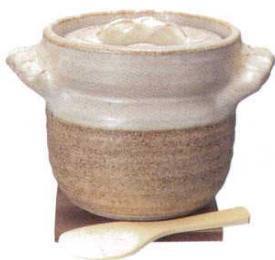
ヨ-34406 635707 10,500円 わら灰3合炊きご飯釜 1×6入 17×17×17cm

よく研いだお米と1.2倍の水を土釜に入れて30分置いた後、蓋をして強火にかけ、ブクブク吹き出したら火を止め、20分蒸らせば出来上がり。2～3分追加炊きをすればおいしいおこげご飯も出来ます。