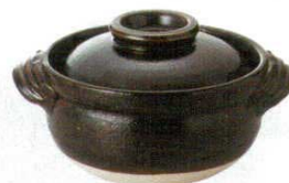
ヨ-34409 635716 3,000円 窯変天目1合炊きご飯釜 1×18入 17×17×9cm