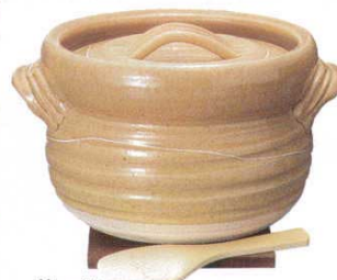
萩一珍 ヨ-34404 635705 9,700円 5合炊きご飯釜 1×4入 23×23×16cm ヨ-34405 635706 7,300円 3合炊きご飯釜 1×6入 19×19×16cm