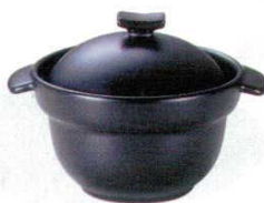
ヨ-34421 635721 3,650円 黒マット1合炊きご飯釜 1×12入 16×9.5cm