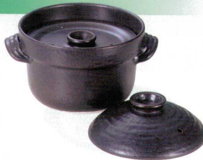
ヨ-34422 635722 7,300円 セリオン3合炊きご飯釜 1×6入 22.5×14cm