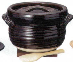
ヨ-34403 635704 7,300円 窯変天目3合炊きご飯釜 1×6入 19×19×16cm