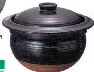
ヨ-34402 635702 7,900円 銀天目5合炊きご飯釜 1×4入 27.5×27.5×19cm