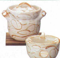
志野釉 ヨ-34415 635714 2,700円 一人用炊きご飯釜 1×20入 9.5×9.5×9.5cm ヨ-34416 635715 2,200円 一人用コンロ 1×24入 10×10×7cm