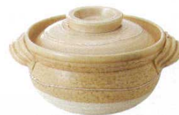
ヨ-34410 635717 3,000円 萩一珍1合炊きご飯釜 1×18入 17×17×9cm