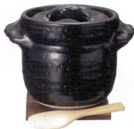
ヨ-34407 635708 10,500円 黒釉3合炊きご飯釜 1×6入 17×17×17cm