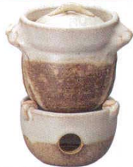
わら灰 ヨ-34411 635710 2,700円 一人用炊きご飯釜 1×20入 9.5×9.5×9.5cm ヨ-34412 635711 2,200円 一人用コンロ 1×24入 10×10×7cm