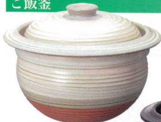
ヨ-34401 635701 7,900円 粉引5合炊きご飯釜 1×4入 27.5×27.5×19cm