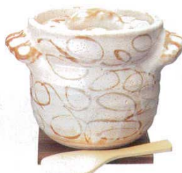
ヨ-34408 635709 10,500円 志野釉3合炊きご飯釜 1×6入 17×17×17cm