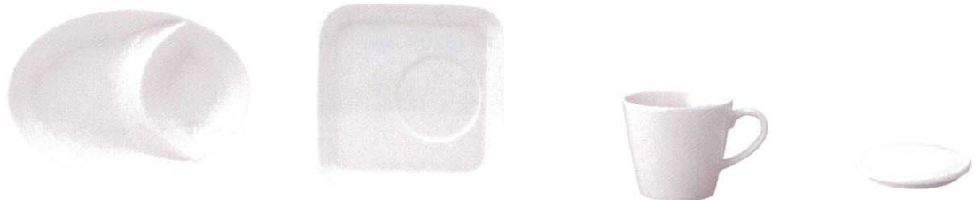
ケ-48805 659365 1,200円 N-23 セパレートプレート 60入 16×24×3.2cm