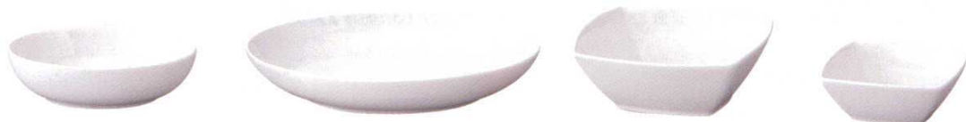
ケ-48809 659369 450円 N-23 サラダボール 60入 11×15×4.3cm