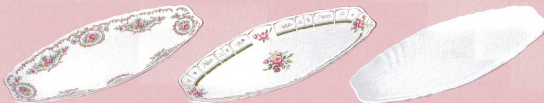
ナ-48813 656010 5,000円 ロイヤルローズサンドイッチトレー 24入 35.5×20×3cm