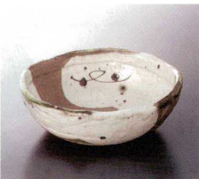
ホ-06009 606607 4,050円 手造り粉引掛分け4.7鉢 60入 14.2×4.9cm