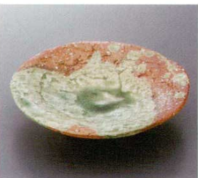
エ-06017 706017 3,500円 伊賀荒磯丸向附 30入 17×4cm