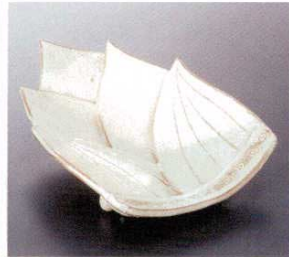
ヤ-06003 606605 4,700円 粉引竹の子盛皿 40入 18×13.5×5.5cm