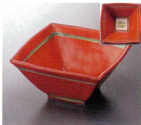
ホ-06010 606614 4,000円 朱巻双魚角深小鉢 60入 13×13×6.3cm