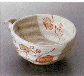
コ-06013 706013 3,700円 赤絵山帰来片口鉢 1×40入 13×11×6.5cm