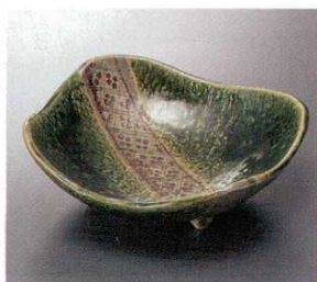
ホ-06020 606613 3,800円 手造り織部小紋足付楕円向附 40入 16.6×15×5cm