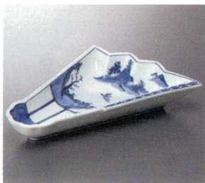
エ-06014 606611 3,620円 染付山水扇面向附 40入 20.7×14×3cm