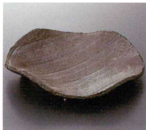
エ-06006 706006 4,000円 黒ストライプ文変形向附 30入 19×18×4.3cm