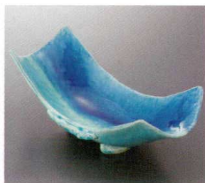
ツ-06016 706016 3,600円 二彩かいらぎ長角向附 30入 24.5×8.5×9.5cm