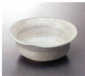
ホ-06012 606610 3,700円 手造り淡彩粉引向附 60入 14.3×5.5cm