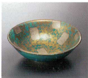
ホ-06019 606609 3,600円 緑釉金銀彩向附 60入 15.5×5cm