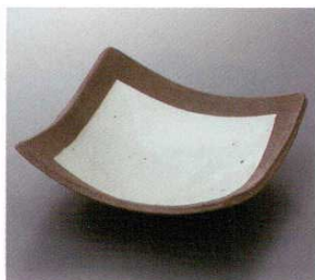
ユ-06015 706015 3,600円 白釉掛分け正角鉢 10入 17×17×5.5cm