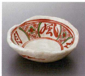
ホ-06011 706011 3,800円 赤絵雪月花小判鉢(小)(手造り) 50入 15×14×4.7cm