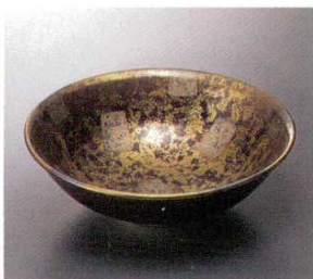
ホ-06018 606616 3,600円 紫釉金銀彩向附 60入 15.5×5cm