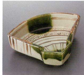
コ-06004 606606 4,000円 織部扇面向附 40入 15×12.5×4.5cm