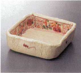
ホ-06001 606602 5,600円 手造り花蝶角鉢 20入 14.7×14.7×4.5cm