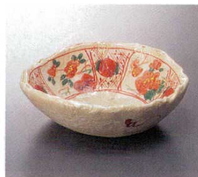
ホ-06008 606608 3,850円 花蝶小判鉢(小)(手造り) 50入 15×13.5×4.7cm