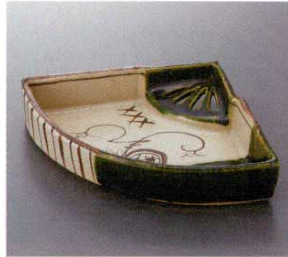
マ-06002 602108 4,500円 織部唐草扇面鉢5.0 40入 16.5×15.7×3.5cm