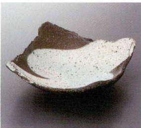
エ-06005 706005 4,000円 黒うずら紋四方向附 20入 16×16×6cm