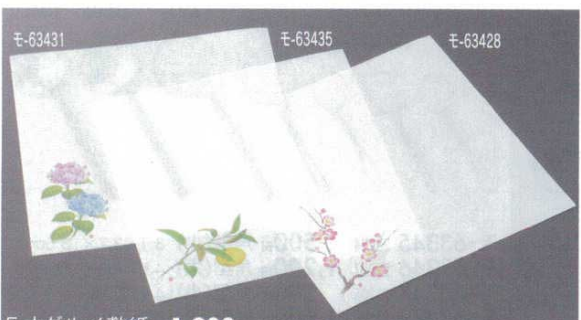
5寸グルメ敷紙 1,900円 100枚 15×15cm