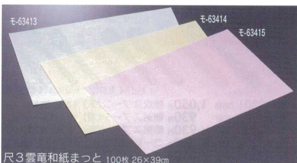
尺3雲竜和紙まっと 100枚 26×39cm