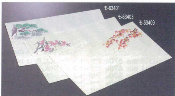
尺3水墨懷石まっと 3,800円 100枚 26×38.5cm