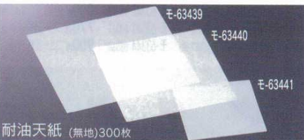
耐油天紙 (無地) 300枚