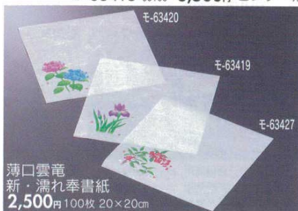
薄口雲竜 新・濡れ奉書紙 2,500円 100枚 20×20cm