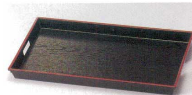
黒天朱 運び盆(ノンスリップ)

フ-64531 653206 21,800円 18寸(セット) 59×48×30cm(ABS・SH) フ-64532 653207 7,800円 18寸(盆ノミ) 54.8×43.8×3.5cm(ABS・SH)