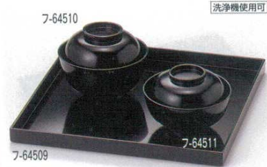
黒 懐石膳と小丸椀

フ-64505 764505 2,500円 朱飯椀 12.3×9.2cm(木合・耐漆) フ-64506 764506 2,400円 朱汁椀 11.4×8.7cm(木合・耐漆) フ-64507 764507 2,700円 朱平椀 13.2×7.3cm(木合・耐漆) フ-64508 764508 2,400円 朱坪椀 10.1×8.9cm(木合・耐漆)