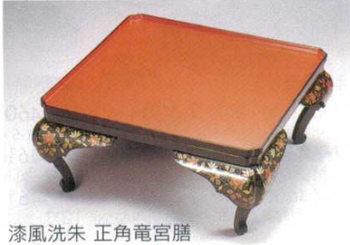
漆風洗朱 正角竜宮膳

フ-64518 764518 2,000円 飯椀 12.4×6.8cm(樹脂・耐熱) フ-64519 764519 1,900円 汁椀 11.6×7.7cm(樹脂・耐熱) フ-64520 764520 2,000円 平椀 10.5×7.8cm(樹脂・耐熱) フ-64521 764521 2,300円 平椀 13×6.1cm(樹脂・耐熱) フ-64522 764522 5,500円 10寸黒(漆風NS)足付膳 30.2×14.3cm(ABS・SH) フ-64523 764523 6,500円 12寸黒(漆風NS)足付膳 36.1×15.8cm(ABS・SH)