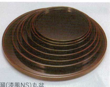
溜(漆風NS)丸盆 フ-64630 653533 2,400円 8寸 24×2cm(ABS・NS) フ-64631 653534 2,600円 8.5寸 25.4×2cm(ABS・SH) フ-64632 653535 3,000円 9寸 27×2.2cm(ABS・SH) フ-64633 653536 3,300円 10寸 30×2.5cm(ABS・SH) フ-64634 653537 3,800円 11寸 33×2.8cm(ABS・SH) フ-64635 653538 6,500円 12寸 35.8×2.4cm(ABS・SH) フ-64636 653539 7,800円 13寸 39×2.4cm(ABS・SH) フ-64637 653540 9,600円 15寸 45.2×2.5cm(ABS・SH)