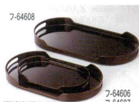
7-64608 溜(漆風NS) フ-64606 653610 2,500円 手付小判トレイ 23×13×2.6cm(ABS・SH) フ-64607 653611 3,500円 NS小判運び盆11寸 30.8×19×3cm(ABS・SH) フ-64608 653612 3,600円 NS小判運び盆12寸 36.4×19×3.5cm(ABS・SH)