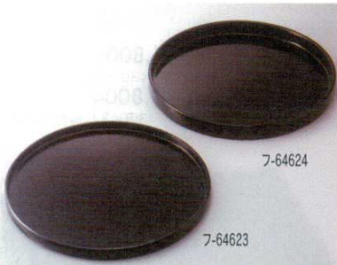
フ-64623 764623 4,500円 黒11寸丸盆 33×2cm(木・漆・輸入) フ-64624 764624 4,800円 黒11寸茶盆 33×3cm(木・漆・輸入)