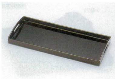
フ-64601 653613 4,500円 溜(漆風NS)細長角運び盆 44.3×19.3×4.8cm(ABS・SH)