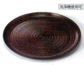
フ-64619 653504 3,400円 NS柄塗 糸筋丸盆 29.9×2.1cm(木合・耐熱NS)