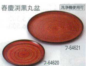
春慶淵黒丸盆 フ-64620 764620 3,800円 7寸 21×1.9cm(木合・耐熱SH) フ-64621 764621 4,800円 10寸 29.9×2.1cm(木合・耐熱SH)