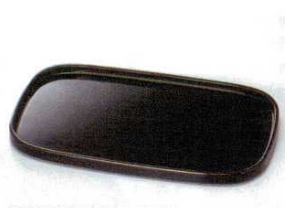
溜(漆風NS)小判盆 フ-64613 653507 2,600円 9寸 28.5×17×1.7cm(ABS・SH) フ-64614 653508 2,700円 10寸 30×23×1.7cm(ABS・SH)