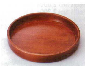
フ-64622 764622 7,500円 尺0茶盆拭漆 30×4.2cm(木・漆・輸入)