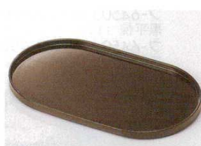
溜(漆風NS)コーヒー盆 フ-64615 653509 2,600円 10寸 30×17.2×1.8cm(ABS・SH) フ-64616 653510 3,800円 13寸 38×22×1.8cm(ABS・SH)