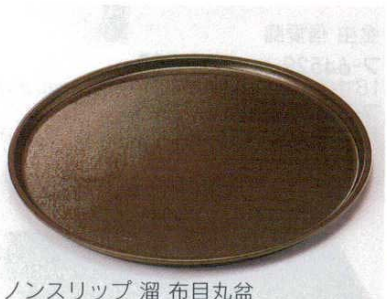
ノンスリップ 溜 布目丸盆 フ-64625 653528 2,100円 10寸 30.2×1.8cm(ABS・NS) フ-64626 653529 2,500円 11寸 33×1.8cm(ABS・NS) フ-64627 653530 2,800円 12寸 36.3×1.8cm(ABS・NS) フ-64628 653531 3,400円 13寸 39×2cm(ABS・NS) フ-64629 653532 4,200円 14寸 42×2cm(ABS・NS)