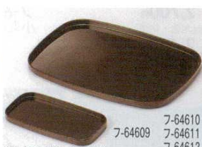
溜(耐熱)小判盆 フ-64609 653606 2,000円 7寸 21.5×11.2×1.8cm(木合・耐熱漆) フ-64610 653607 3,100円 10寸 30.5×21.8×1.8cm(木合・耐熱漆) フ-64611 653608 3,800円 12寸 36.2×27.3×1.8cm(木合・耐熱漆) フ-64612 653609 4,500円 13寸 39×29×2cm(木合・耐熱漆)