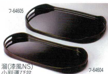
7-64605 7-64604 溜(漆風NS)小判運び盆 フ-64604 653616 4,200円 14寸 43.5×19×3.8cm(ABS・SH) フ-64605 653617 6,000円 15寸 45×28.4×4.2cm(ABS・SH)