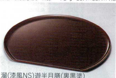
溜(漆風NS)遊半月膳(裏黒塗)

フ-64807 653328 3,800円 11寸 33×29.1×1.2cm(ABS・SH) フ-64808 653329 4,500円 12寸 36×32.3×1.8cm(ABS・SH) フ-64809 653330 5,000円 13寸 39.4×35.4×1.8cm(ABS・SH)