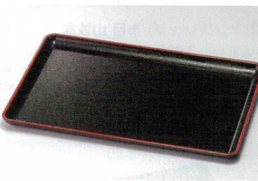
黒天朱 木目長手盆

フ-64837 653401 1,150円 8寸角 24.1×24.1×2cm(ABS・ウレタン) フ-64838 653402 1,400円 9寸角 27.5×27.5×2cm(ABS・ウレタン) フ-64839 653403 1,700円 10寸角 30.5×30.5×2.1cm(ABS・ウレタン) フ-64840 653404 2,100円 11寸角 33.5×33.5×2.2cm(ABS・ウレタン) フ-64841 653405 2,400円 12寸角 36.5×36.5×2.5cm(ABS・ウレタン)