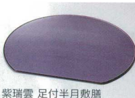
紫瑞雲 足付半月敷膳

フ-64801 764801 3,800円 漆風溜 11.5寸 34.5×30.3×1.8cm(ABS・SH)