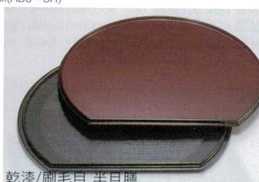
乾漆/刷毛目 半月膳

フ-64810 653339 4,200円 12寸 36×31×1.3cm(ABS・SH) フ-64811 653340 4,700円 13寸 39×33.8×1.3cm(ABS・SH) フ-64812 653341 5,200円 14寸 41.8×36×1.3cm(ABS・SH) フ-64813 653342 5,900円 15寸 45×38.8×1.5cm(ABS・SH)