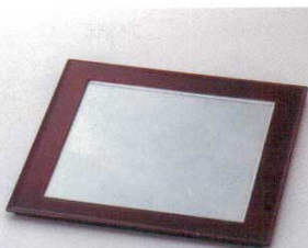
銀帯溜裏黒プレート

フ-64901 764901 7,800円 10寸角 29.9×29.9×1.4cm(ABS・SH) フ-64902 764902 8,400円 11寸角 33.1×33.1×1.4cm(ABS・SH)