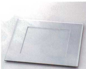
総銀地裏黒プレート

フ-64903 764903 4,300円 10寸角 29.9×29.9×1.4cm(ABS・SH) フ-64904 764904 4,800円 11寸角 33.1×33.1×1.4cm(ABS・SH)